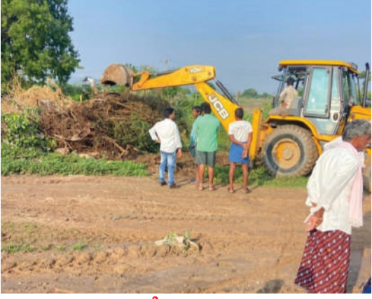
మర్రిగూడ ప్రజా స్వేచ్ఛ

-దామర భీమనపల్లి ఎంపీటీసీ సిలివేరు విష్ణు