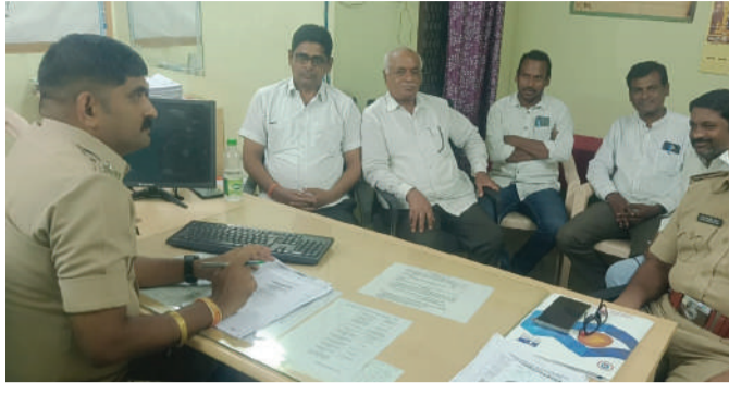
పేపర్స్, డ్రైవింగ్ లైసెన్స్ జతపరచి ఉండాలని ముఖ్యంగా డ్రైవర్ బస్సు నడిపేటప్పుడు సెల్ఫీస్