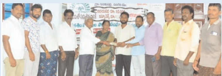
ప్రజా స్వేచ్ఛ - /సంగెం

-పొదుపు సంఘం ఆధ్వర్యంలో భీమా నగదు అందజేత -వికశిలా పురుషుల పొదుపు సంఘం ఆధ్వర్యంలో భీమా సొమ్ము అందజేత