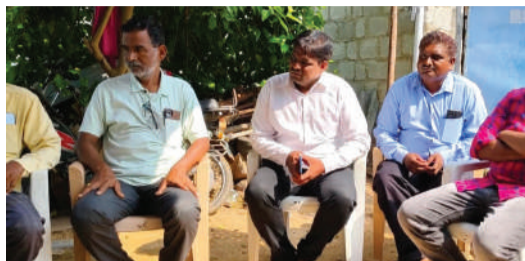
ప్రజా స్వేచ్ఛ - ఆలేరు ఆర్సీ :