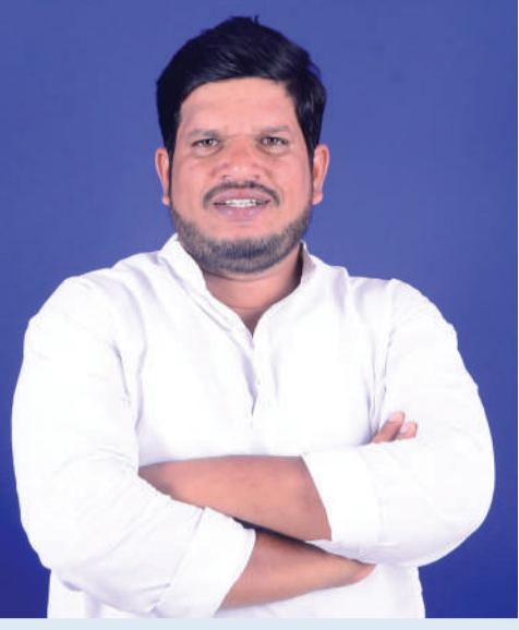
ప్రజా స్వేచ్ఛ- ఆలేరు ఆర్టీ :