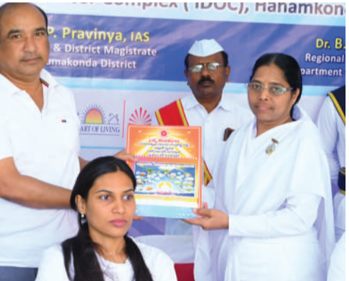
ప్రజా స్వేచ్ఛ- ప్రతినిధి/హన్మకొండ

- కలెక్టర్ కలెక్టర్ ప్రావీణ్య.. -ప్రతిఒక్కరూ విధిగా యోగాను అలవాటు చేసుకోవాలి... -ఎమ్మెల్యేలు నాయిని రాజేందర్ రెడ్డి, కెఆర్ నాగరాజు..