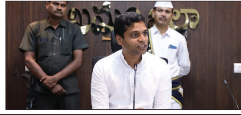
-జిల్లా కలెక్టర్ ముజమ్మిల్ ఖాన్