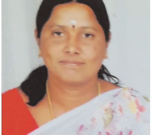
కోన్న మల్లమ్మ ఉపాధి హామీ కులీ

క్రమక్రమంగా వేతనాల చెల్లింపుల్లో ఆలస్యం చేస్తుండటంతో కులీల జీవనానికి అద్దకంగా ఇబ్బందులు ఎదురవుతున్నాయి. ఇలా ఆలస్యంగా వేతనాల చెల్లింపుల వలన కులీలకు అద్దక ఇక్కట్లు ఎక్కువై ఉపాధి హామీ పనులకు రావడానికి సుముఖత వ్యక్తం చేయడంలేదు. ప్రభుత్వం, అధికారులు వత్తిడి వలన ఉపాధి హామీలో కిందిస్థాయిలో పనులు చేస్తున్న ఉద్యోగులు కులీలను పనులకు రావాలని బలవంతంగా తీసుకుని వచ్చి పనులు చెప్పిస్తున్న సందర్భాలున్నాయి. అలా వారిని కులీ డబ్బులు ఇవ్వాలని నిలదీస్తుండటంతో ఏమీ చేయలేక మానసికంగా కృంగిపోతున్నారు. కులీలకు సరైన సమయంలో వేతనాలు రాకపోవడంతో వారు ఇల్లు గడవడం చాలా కష్టంగా ఉంది అంటున్న ఉపాధి హామీ కులీలు. ప్రభుత్వం ప్రభుత్వ అధికారులు స్పందించి కులీలకు రావాల్సిన వేతనాలను వారంవారం వెంటవెంటనే చెల్లించాలని ఉపాధి హామీ కులీలు కోరుతున్నారు.