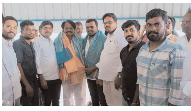
ప్రజా స్వేచ్ఛ ఎన్టీసీ