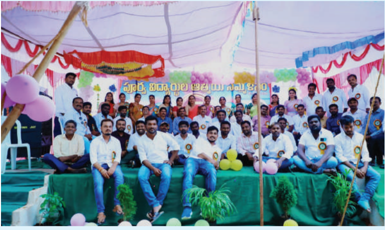
ప్రజా స్వేచ్ఛ హాలియా జూలై 28

నాగార్జునసాగర్ నియోజకవర్గంలోని హాలియా మున్సిపాలిటీ పరిధిలో నాగార్జున ఉన్నత పాఠశాలకు సంబంధించిన 2006 2007 బ్యాచ్ పూర్వ విద్యార్థుల సమ్మేళనం పాఠశాల ఆవరణలో ఘనంగా నిర్వహించారు. ఈ కార్యక్రమంలో పాఠశాల కు సంబంధించిన ఉపాధ్యాయులు పూర్వ విద్యార్థులు హాజరై ఆత్మీయంగా పలకరించుకున్నారు పాఠశాలలో చదువుకున్నప్పటి వాటి జ్ఞాపకాలను గుర్తు చేసుకుంటూ గడిపారు. తమ విద్యార్థులు అందరూ ఉన్నతమైన స్థానాలకు చేరుకున్నారు ఉపాధ్యాయులు ఆనందాన్ని వ్యక్తం చేశారు.