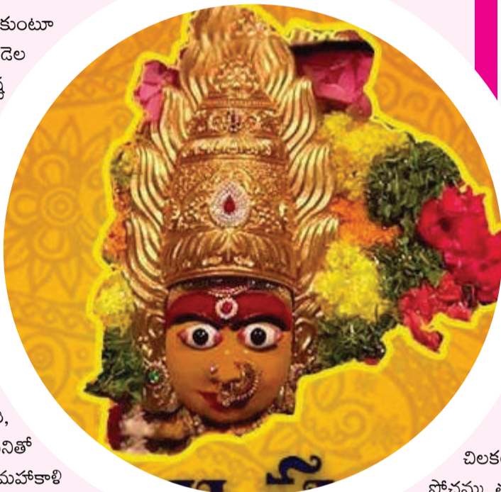
చిలకలగూడలోని పోచమ్మ తల్లి పాతబస్తీ లాల్ దర్వాజాలోని మాతేశ్వరి జూబ్లీహిల్స్ లోని