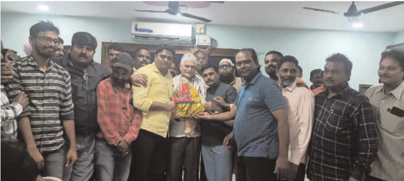
- టి యూ డబ్ల్యూ జె ఎఫ్ ఉమ్మడి వరంగల్ జిల్లా ఉర్దూ జర్నలిస్టు కమిటీ

ప్రజా స్వేచ్ఛ-వరంగల్ జిల్లా బ్యూరో : తెలంగాణ మీడియా అకాడమీ చైర్మన్ బాధ్యతలు