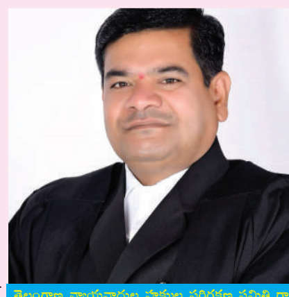
తెలంగాణ న్యాయవాదుల పాత్రుల సచివాలయ సమితి రాష్ట్ర అధ్యక్షుల ఉపాధ్యక్షుల మహాసభ ప్రజాసభ రివైజ్ ఇన్స్టి. కాంగ్రెస్ నాయకుడు

రైతు బీమా కోసం 2024 జూన్ 28 నాటికి ల్యాండ్ రిజిస్ట్రేషన్ అయినవారు, ఇంతకుముందు భూమి పాసుబుక్ వచ్చి రైతు బీమా చేయించుకొని వారు రైతు బీమాకు దరఖాస్తు చేసుకోవచ్చు. లివివరి తేదీ ఆగస్టు 5, అలాగే ఇంతకుముందు రైతు బీమా చేసుకొని అందులో నామిని యొక్కు మార్పునకు చివరి తేదీ జూలై 30, 18 నుంచి 59 సంవత్సరాల మధ్య గల రైతులు దరఖాస్తు ఫారానికి పట్టా పాస్ బుక్, ఆధార్ కార్డ్, నామిని ఆధార్ కార్డు జిరాక్స్ కాపీలతో స్వయంగా వచ్చి దరఖాస్తు ఫారాన్ని ఇవ్వాలి