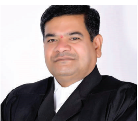
తెలంగాణ న్యాయవాదుల పాక్షిక పరిరక్షణ సమితి రాష్ట్ర అధ్యక్షుడు తరిగంపల్లి మహేందర్ ప్రజాసభ ఏర్పర్ర అడ్వ్. కాంగ్రెస్ నాయకుడు

దక్షిణాది రాష్ట్రాలకు మొండిచెయ్యిని చూపింది. కేంద్రానికి వస్తున్న పన్నుల ఆదాయంలో అత్యధిక వాటా దక్షిణాది రాష్ట్రాలదే. దశాబ్దాలుగా పలురకాల వివక్షను, అణచివేతను అనుభవించిన తెలంగాణకు బడ్జెట్ ఏడుపునే మిగిలించింది. 8 సీట్లను కట్టబెట్టిన తెలంగాణకు నిధులు కేటాయింపులో భరించలేని వివక్షను చూపుతున్నది. కేంద్రానికి వస్తున్న పన్నుల, సేవల ఆదాయంలో సగంపైగా శ్రామిక ఉత్పాదకవర్గాల నుంచి వస్తున్నది. కానీ వీరికి సామాజిక భద్రత విద్య, వైద్యం అందించే అంశాలలో తీవ్ర నిర్లక్ష్యాన్ని ప్రదర్శించింది. సార్వత్రిక విద్య, వైద్యం సంక్షేమరాజ్య పునాదులు అని ఆర్థిక సర్వే తేల్చిచెప్పింది. ప్రజలు తమ సంపాదనలో 75 శాతం వెచ్చిస్తున్నారని చెప్పింది. భారత్లో వ్యాపారవేత్తలు, పారిశ్రామిక అధిపతులు లాభాల సముద్రంలో విహరిస్తున్నారని కూడా ప్రస్తావించింది. కానీ బడ్జెట్లో ఈ అంశాలను కనీసం పరిగణనలోకి తీసుకోలేదు. జీడీపీలో విద్యకు 6 శాతం, వైద్యానికి 3 నిధులు కేటాయించాలని సూచించింది. విద్య, వైద్యం ఆధారంగా వెలువరించే మానవాభివృద్ధి సూచిక-2024లో భారత్ 134వ స్థానాన్ని కలిగి ఉన్నది. ఈ సూచిక ఎన్నియే కాలంలో క్షీణిస్తూ పోతున్నది. విద్యకు రూ.1,25,638 కోట్లు, వైద్యానికి రూ.89,287 కోట్లు కేటాయించారు. ఇవి జీడీపీలో ఒక శాతం లోపే ఉంటాయి. ఉమ్మడి జాబితాలోని విద్యపై కనీస పట్టించు లేదు. పీఎం పోషణ్, రాష్ట్రాల యూనివర్సిటీలకు నిధులను భారీగా తగ్గించారు.