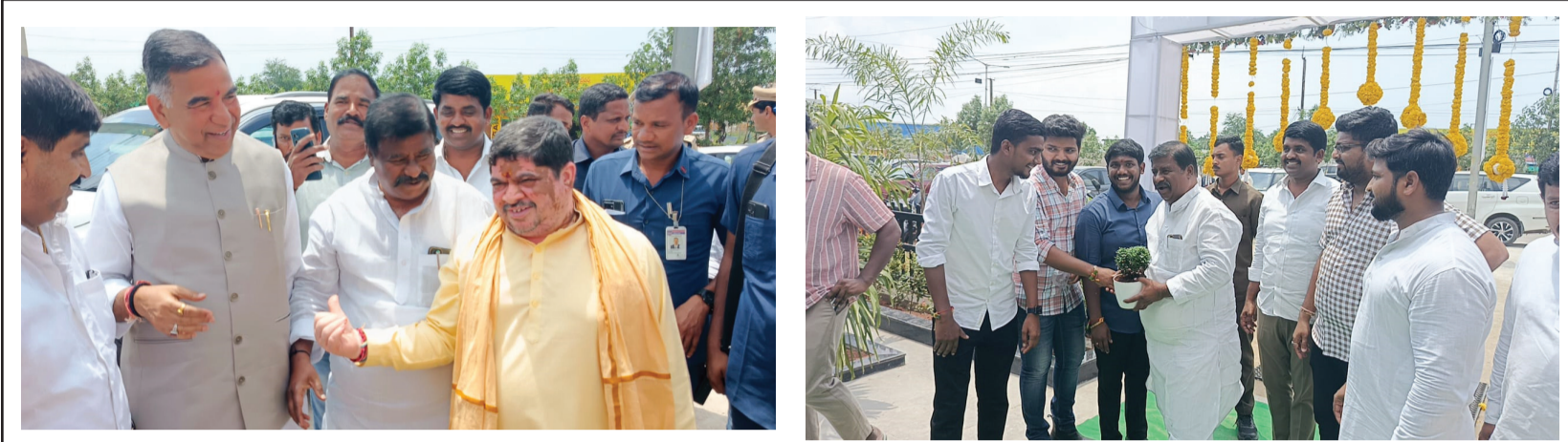
ప్రజా స్వేచ్ఛ ఎగ్జిక్యూటివ్