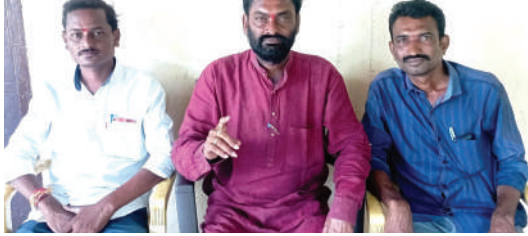
చెల్లించాలని, అన్ని హస్తాక్షరం సొంత భవనాలు నిర్మించాలని తెలంగాణ రాష్ట్ర రాజధాని హైదరాబాద్ లో 10 కాలేజీ హాస్టల్స్, అన్ని జిల్లాల్లో 5 కాలేజీ హాస్టల్ లో మంజూరు చేయాలని దరఖాస్తు చేసుకున్న ప్రతి విద్యార్థికి అదనపు సెక్సెన్సు కేటాయింది సీట్లు ఇవ్వాలని పెండింగ్ ఫీజు బకాయిలు చెల్లించి విద్యార్థులకు ప్రభుత్వం అండగా ఉండాలని ఆయన కోరారు గతంలో అధికారంలో ఉన్న డిఎన్ఎస్