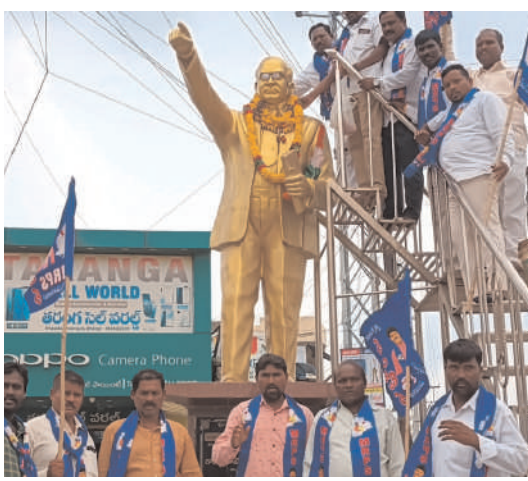
సిద్దింగా ఉన్నాము అని అసెంబ్లీలో మాట్లాడిన ముఖ్యమంత్రి రేవంత్ రెడ్డి. వెంటనే ఇంప్లిమెంటేషన్ పాల్గొన్నారు.

ప్రజా స్వేచ్ఛ, ఆలేరు ఆర్పీ : యాదాద్రి భువనగిరి జిల్లా ఎస్సీ వర్గీకరణపై ఆగస్టు ఒకటవ తేదీన సుప్రీంకోర్టు సంచలనాత్మక తీర్పు వెలువరించిన వెంటనే తెలంగాణ రాష్ట్ర ముఖ్యమంత్రి రేవంత్ రెడ్డి అసెంబ్లీలో మాట్లాడుతూ రాష్ట్రంలోని మాదిగలు 30 సంవత్సరాల నుండి ఏబీసీడీ వర్గీకరణ కోసం రాజీదేని పోరాటాలు చేస్తున్నారని వారికి సుప్రీమ్ కోర్ట్ లో తీర్పు అనుకూలంగా వచ్చినందుకు రాష్ట్ర ప్రభుత్వం తరుపున స్వాగతస్తూ రాష్ట్ర ప్రభుత్వం తరుపున ఏబీసీడీ వర్గీకరణ చేయడానికి మేము