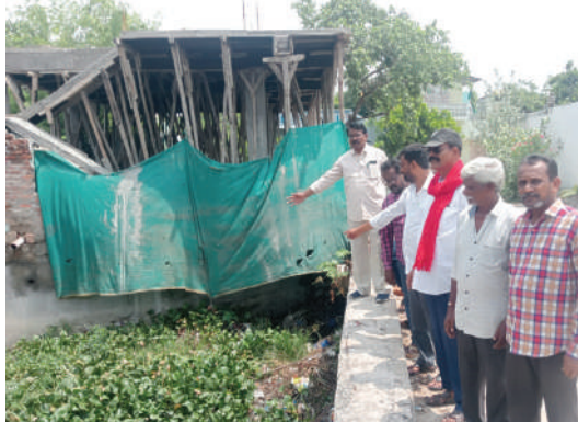
ఉన్నాయని తెలిపారు. గత ఏడాదిగా పూడిక తీయకపోవడంతో పారిశుధ్యం లోపించి దోమలు, ఈగలు వందులు వ్యాప్తి చెంది విషజ్వరాలు సోకుతున్నాయన్నారు. ప్రతి ఇంటిలో ఒకరు జ్వరం బారిన పడి ఇబ్బందులు పడుతున్నారని చెప్పారు. పూడిక తీత పనులకు 50 రోజుల కిందట కౌన్సిల్

-విష జ్వరాలు ప్రబలుకుండ చర్యలు తీసుకోవాలి -మురికికాలువలను పరిశీలించిన సీపీఎం