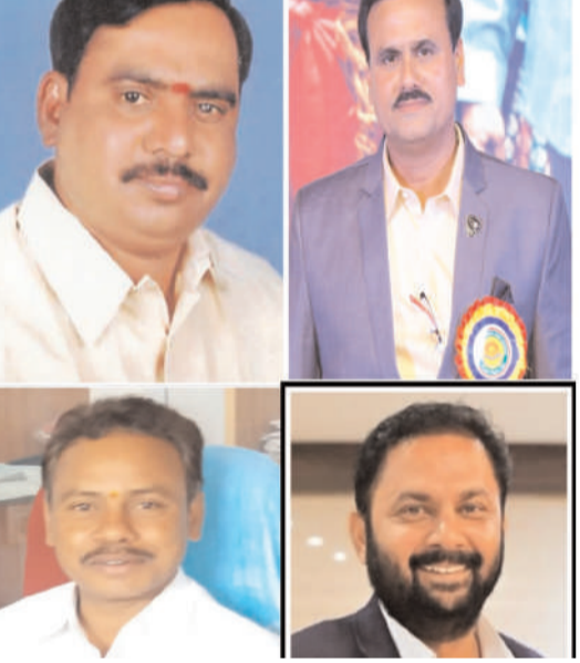
ఉండేలా కొత్త సంఘాన్ని ముందుకు తీసుక పోదామని కరస్పాండెంట్లు సూచించారు. కొత్త సంఘం

తెలంగాణ గుర్తింపు పొందిన ఆఫర్డబుల్ ప్రైవేటు పాఠశాలల అసోసియేషన్ గ్రేటర్ కుత్బుల్లాపూర్ నూతన కమిటీని ఎన్నుకున్నారు. రంగారెడ్డి నగర్ లోని బ్రిట్ కాన్వెన్ట్ స్కూల్లో నిర్వహించిన సర్వసభ్య సమావేశంలో సుమారు 50 పాఠశాలల కరస్పాండెంట్లు వివిధ సమస్యలపై చర్చించారు. ఈ సందర్భంగా పలువురు మాట్లాడుతూ కుత్బుల్లాపూర్ లో ప్రైవేటు పాఠశాలల యాజమాన్యాల సంఘాలు కొందరు వ్యక్తుల కోసమే పనిచేస్తున్నాయని ఆవేదన వ్యక్తం చేశారు. పాఠశాలల యాజమాన్యాల ప్రయోజనాల కంటే వ్యక్తుల ప్రయోజనాలే పరమావధిగా సంఘాలు పనిచేస్తున్నాయని అభిప్రాయపడ్డారు. ఇది ఏ ఒక్కరికీ మంచిది కాదని ఈ పద్ధతులు మార్చాలని అవసరం ఉందన్నారు. వ్యక్తి పూజలతో సంబంధం లేకుండా కేవలం పాఠశాలల సమస్యల పరిష్కారమే ధ్యేయంగా కలిసికట్టుగా