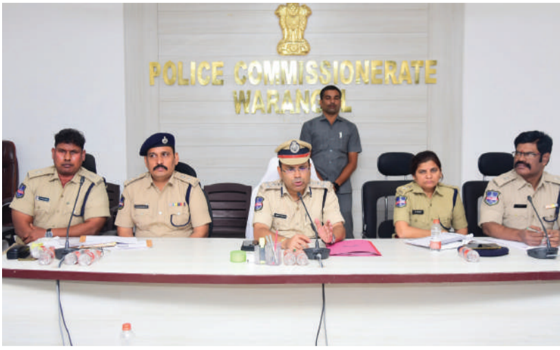
-వరంగల్ పోలీస్ కమిషనర్ అంబర్ కిషోర్ రూ