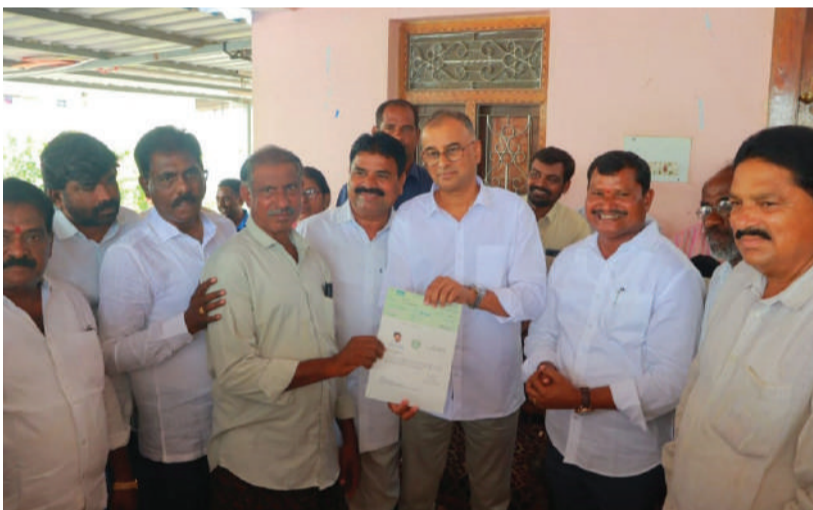
-స్థానిక ఎమ్మెల్యే జారే తో కలిసి 13 లక్షల చెక్కుల పంపిణి -ఎంపీ రఘురాం రెడ్డి

ప్రజాస్వేచ్ఛ/ఖమ్మం జిల్లా బ్యారో ఖమ్మం జిల్లా అశ్వారావుపేట ప్రయివేటు, కార్పొరేట్ ఆస్పత్రుల్లో అత్యవసర వైద్యసేవలు పొందిన పేదలకు రాష్ట్ర ప్రభుత్వం మంజూరు చేసిన సీఎం రిలీఫ్ ఫండ్ చెక్కులను ఖమ్మం ఎంపీ రామ నహాయం రఘురాం గురువారం స్వయంగా లబ్ధిదారుల ఇళ్ళకి వెళ్లి అందజేశారు. అశ్వారావుపేట ఎమ్మెల్యే జారే ఆదినారాయణ తో కలిసి చంద్రగౌండ మండలంలో ఈ కార్యక్రమానికి శ్రీకారం చుట్టారు. దుర్దుకారు, దామరచర్ల, అయ్యానపాలెం, చంద్రగౌండ,