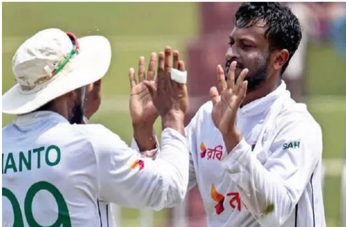
పాకిస్థాన్ తో సిరీస్ ముగిసిన తర్వాత భారత్ తో జరిగే సిరీస్ కు బంగ్లా జట్టు వెళ్లనున్నది. భారత్ తో జరిగే సిరీస్ లోనూ షకీబ్ ఆడాలన్న అభిప్రాయాన్ని వ్యక్తం చేశారు.

బంగ్లాదేశ్ క్రికెటర్ షకీబ్ అల్ హసన్ పై హత్య కేసు నమోదు అయిన విషయం తెలిసిందే. ఆయన్ను జట్టు నుంచి తొలగించాలని కూడా బంగ్లా బోర్డుకు లీగల్ నోటీసులు వెళ్ళాయి.