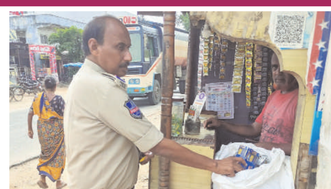
మేరకు బస్టాండ్ ఆవరణలో గులాం సైదానిని వ్యక్తి

ప్రజా స్వేచ్ఛ ప్రతినిధి భువనగిరి నియోజకవర్గం అక్రమంగా గుట్టా ప్యాకెట్లు విక్రయిస్తున్న దుకాణంపై దాడి చేసి గుట్టా ప్యాకెట్లు స్వాధీనం చేసుకున్న ఘటన వలిగాండ పట్టణ కేంద్రంలో జరిగింది. పోలీసులు తెలిసిన పూర్తి వివరాల ప్రకారం వలిగాండ పట్టణ కేంద్రంలో విశ్వసనీయ సమాచారం