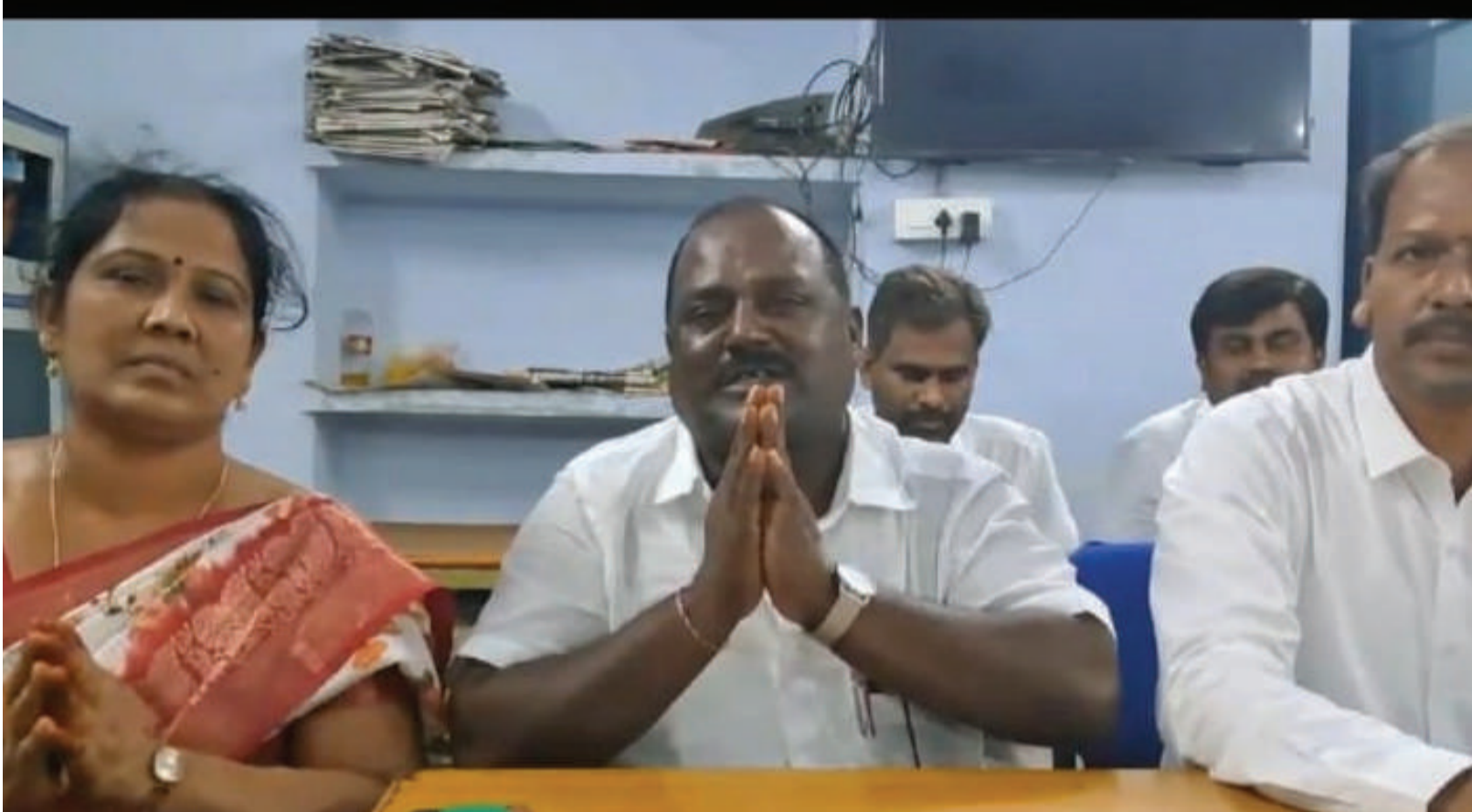
ప్రజా స్వేచ్ఛ ఎత్తినవర్