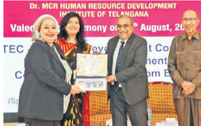
ముగిసింది. ఈ కార్యక్రమానికి ముఖ్య అతిథిగా