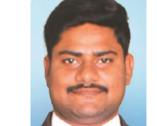
తరిగొప్పుల అమరేందర్ హైకోర్టు న్యాయవాది ఉమెస్ రైట్స్ 'లా'ఆర్ డి ఐ డిపార్ట్మెంట్ టి పి సి సి నెల్ రాష్ట్ర కన్వీనర్