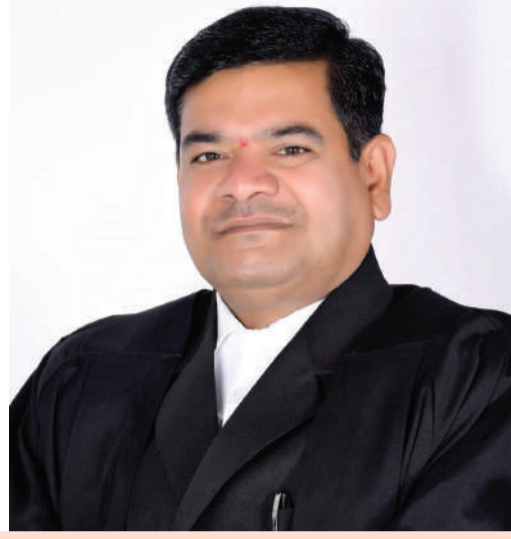
తెలంగాణ న్యాయవాదుల హక్కుల పరిరక్షణ సమితి రాష్ట్ర అధ్యక్షుడు తరిగొప్పుల మహేందర్ ప్రజాపతి రిటైర్డ్ జడ్జి కాంగ్రెస్ నాయకుడు రంగారెడ్డి జిల్లా అధికార ప్రతినిధి

రాష్ట్రంలో 80 శాతానికి పైగా కుటుంబాలు సన్న బియ్యమే తింటున్నాయి. సన్న వడ్డకు అధిక డిమాండ్ ఉన్నప్పటికీ, గత ప్రభుత్వం సన్నాల సాగును ప్రోత్సహించలేదు. గతంలో 25 నుంచి 30 శాతానికి మించి సన్న వడ్డ సాగు జరగలేదు. రైతులు కొన్నేండ్లుగా 20 లక్షల ఎకరాలకు మించి సన్నాలు సాగు చేయలేదు. మూడేండ్ల కింద అప్పటి బీఆర్ఎస్ ప్రభుత్వం సన్న వడ్డ వేయాలని, బోనస్ ఇస్తామని