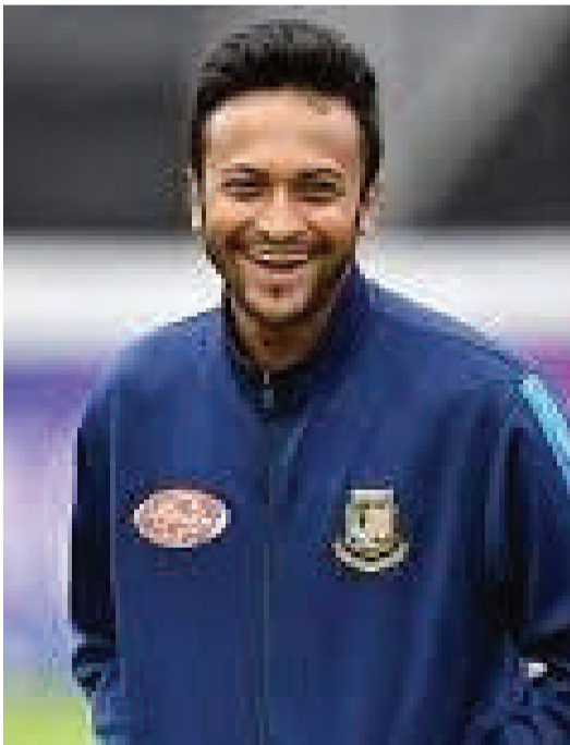
ఆదాలనేది నా కోరిక. అది జరగకపోతే.. ఇదే (కాన్పూర్ టెస్టు) నా చివరి మ్యాచ్ అవుతుందని

బంగ్లాదేశ్ క్రికెట్ జట్టు స్టార్ ఆల్ రౌండర్ షకీబ్ అల్ హాసన్ గురువారం టీ20 క్రికెట్ కి రిటైర్మెంట్ ప్రకటించాడు. కాన్పూర్ లో భారత్ తో జరగనున్న రెండో టెస్టు మ్యాచ్ కు ముందు వెటర్న్ ఈ నిర్ణయం తీసుకున్నాడు. సెప్టెంబర్ 27 నుంచి కాన్పూర్ లో భారత్ తో జరగనున్న రెండో టెస్టు మ్యాచ్ లో షకీబ్ ఆడనున్నాడు. దీని తర్వాత అతడు బంగ్లాదేశ్ తరపున మరో సిరీస్ లో టెస్ట్ క్రికెట్ ఆడబోతున్నాడు. ఆపై అతడు రెడ్ బాల్ క్రికెట్ నుండి రిటైర్ అవుతాడు. దక్షిణాఫ్రికాతో మిరపూర్ లో జరిగే టెస్టు తనకు చివరి టెస్టు అని చెప్పాడు. భారత్ తో రెండో టెస్టుకు ముందు కాన్పూర్ లో షకీబ్ మీడియాతో మాట్లాడాడు. "రిటైర్ అవడం నా కోరిక. నేను నా నిర్ణయాన్ని బీసీబీ మరియు సెలెక్షన్ బోర్డుకు చెప్పాను. "వారు నాతో ఏకీభవించారు. నేను బంగ్లాదేశ్ కు తిరిగి వెళ్లి ఆ రెండు టెస్ట్ మ్యాచ్ లు ఆడుతాను. మిరపూర్ లో నా టెస్ట్ కెరీర్ ను ముగించడానికి వీలుగా వారు ప్రయత్నిస్తున్నారని పేర్కొన్నాడు. "నా చివరి మ్యాచ్ గా