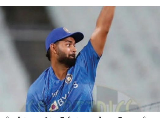
ఫస్ట్ వీడియో సోషల్ మీడియాలో వైరల్ అవుతోంది. ఇందులో పంత్ గిల్ కు ముచ్చెముటలు వట్టించారు. పంత్ బౌలింగ్ చేస్తుంటే.. గిల్ కష్టంగా ఆడుతున్నట్లు కనిపించింది. ఈ వీడియోలో మీరు ఢిల్లీ ప్రీమియర్ లీగ్ లో కూడా బౌలింగ్ చేశారా అని పంత్ ను కేవల రాహుల్ అడిగాడు. కాన్పూర్ పిచ్ స్పిన్ ను సహకరించనున్నట్లు తెలుస్తోంది. ఈ పరిస్థితుల్లో ముగ్గురు స్పిన్ నర్లతో టీమిండియా ఫీల్డింగ్ చేస్తే

బంగ్లాదేశ్ తో జరగనున్న రెండో టెస్టుకు టీమిండియా కనరత్తు చేస్తోంది. సెప్టెంబర్ 27 నుండి కాన్పూర్ లోని గ్రీన్ పార్క్ లో జరగనున్న టెస్టులో ఇరు జట్టు తలపడనున్నాయి. ఈ సిరీస్ లోని మొదటి టెస్టులో చెన్నైలో భారత జట్టు అద్భుతమైన ప్రదర్శనతో విజయం సాధించింది. రెండో టెస్టుకు ముందు, మ్యాచ్ తో పాటు సిరీస్ ను కైవసం చేసుకునేందుకు టీమిండియా తన నైపుణ్యాలను మెరుగుపరుచుకుంటుంది. నెట్స్ లో బ్యాటింగ్ లో, స్టార్ ఇండియా బ్యాటర్లు రిషబ్ పంత్ మరియు శుభమ్ గిల్ మధ్య జరిగిన క్షణం వైరల్ అయ్యింది. టీమిండియా స్టార్ బ్యాట్స్ మెన్ శుభమ్ గిల్ బ్యాటింగ్ ప్రాక్టీస్ వీడియోను బీసీసీఐ షేర్ చేసింది. అందులో.. గిల్ కు రిషబ్ పంత్ బౌలింగ్ చేస్తున్నట్లు కనిపిస్తోంది. ఈ రోజు ప్రాక్టీస్ సెషన్ లో భాగంగా పంత్ బౌలింగ్ చేయడం కనిపించింది. కాగా.. ఈ