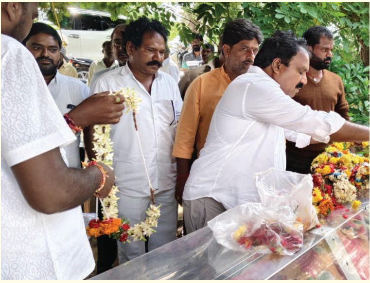
ప్రజా స్వేచ్ఛ ప్రతినిధి/వరంగల్: