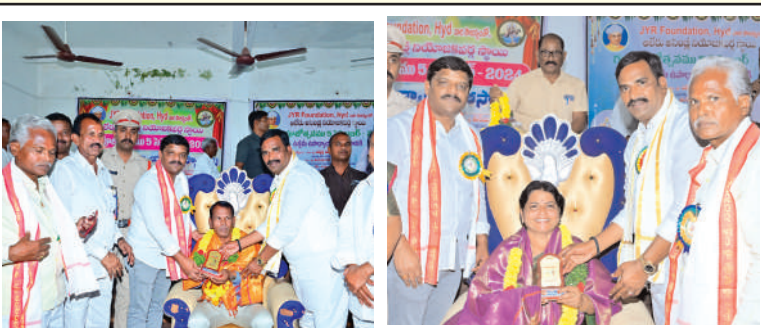
ప్రజా స్వేచ్ఛ ఆలేరు ఆర్డీ:

పాల్గొన్న ప్రభుత్వ విప్ ఆలేరు ఎమ్మెల్యే బీర్ల ఐలయ్య