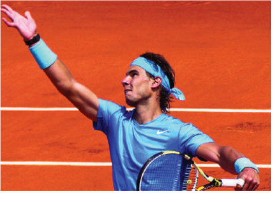
భావోద్వేగంతో పేర్కొన్నాడు. గత కొంతకాలంగా గాయాలతో సతమతమవుతున్న నాదల్ ఈ ఏడాది నాలుగు గ్రాండ్ స్లామ్ టోర్నీల్లో మూడింట పాల్గొనలేదు. చివరగా ప్యారిస్ ఒలింపిక్స్ లో బరిలోకి

టెన్సిస్ దిగ్గజం రఫేల్ నాదల్ ఆటకు వీడ్కోలు పలికాడు. రెండు దశాబ్దాలకు పైగా సుదీర్ఘమైన కెరీర్ ఆడిన నాదల్ గురువారం రిటైర్మెంట్ ప్రకటించాడు. 38 ఏళ్ల ఈ స్పెయిన్ దిగ్గజం వచ్చే నెలలో జరిగే డేవిస్ కప్ లో చివరిసారిగా బరిలోకి దిగి ఆటకు గుడ్ బై చెప్పనున్నాడు. రఫేల్ నాదల్ 22 గ్రాండ్ స్లామ్ టైటిళ్లు సాధించాడు. సోఫల్ మీడియాలో వీడియోను పోస్ట్ చేసి రఫేల్ నాదల్ ఈ సంచలన నిర్ణయాన్ని ప్రకటించాడు. "మితో ఓ విషయాన్ని పంచుకోవడానికి వచ్చాను. ప్రోఫెషనల్ టెన్సిస్ నుంచి రిటైర్ అవుతున్నాను. గత కొన్నాళ్లు.. ముఖ్యంగా గత రెండేళ్లు కష్టతరంగా సాగాయి. నేను పరిమితులు లేకుండా ఆడానని నేను అనుకోవట్లేదు" అని రఫేల్ నాదల్