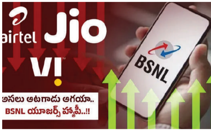
అసలు ఆటగాడు ఆగయా.. BSNL యూజర్స్ హ్యాపీ..!!

దేశీయ టెలికాం వ్యాపారంలో బీఎస్ఎన్ఎల్ అతిపెద్ద ఆటగాడిగా అవతరించేందుకు రంగం సిద్ధం అవుతోంది. ఇప్పటికే ఈ రంగంలో ప్రైవేటు ఆటగాళ్ల హవా ఒకవక్కా కోససాగుతుండగా.. మరోవక్కా ప్రభుత్వ యాజమాన్యంలోని కంపెనీ స్పెషల్ ఫీచర్లు, ఆఫర్లతో కస్టమర్లను ఆకర్షిస్తోంది. ఇదే క్రమంలో బీఎస్ఎన్ఎల్ తాజాగా జియో, ఎయిర్టెల్, వాడఫోన్ ఐడియాలు తమ యూజర్లకు అందించని సరికొత్త ఫీచర్ తీసుకొచ్చింది. రోజూ కోట్ల మంది టెలికాం యూజర్లు ఎదుర్కొంటున్న ఈ ప్రధాన సమస్యకు పరిష్కారాన్ని తీసుకొచ్చింది. దేశంలోని ప్రైవేటు టెలికాం ఆపరేటర్లు కొన్ని నెలల కింద తమ టారిఫ్ రేట్లను పెంచిన సంగతి తెలిసిందే. వాస్తవానికి జియో రేట్ల పెంపును ప్రారంభించగా దానిని ఇతర ఆపరేటర్లు ఫాలో అయ్యారు. ప్రధానంగా కంపెనీలు 5జీ పెట్టుబడులు, నెట్ వర్క్ విస్తరణపై ఎక్కువగా పెట్టుబడులు పెట్టడంతో ఆ ఖర్చులను భర్తీ చేసుకునేందుకు వీలుగా రేట్ల పెంపుకు పాల్పడ్డాయి. ఈ క్రమంలో చాలా మంది ఘర్ వాపసీ నినాదంతో తిరిగి బీఎస్ఎన్ఎల్ వైపు మారారు. అయితే యూజర్లను సంక్షోభ పెట్టేందుకు వేగంగా 4జీ సేవల విస్తరణను