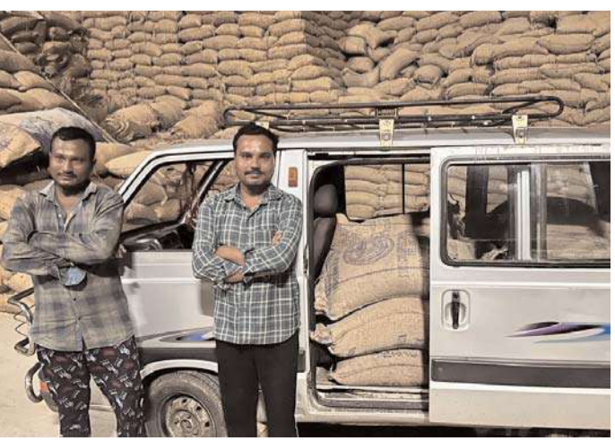
మిల్లులోకి వచ్చిన మారుతి వ్యాన్ ను స్వాధీనం తరలించారు.

ఖిల్లా గణపురం అక్టోబర్ 14 వనపర్తి జిల్లా ఖిల్లా గణపురం మండల కేంద్రంలోని దివ్య నవ్య రైస్ మిల్లులో రేషన్ బియ్యం తరలిస్తున్న మారుతి వ్యాన్ ను సోమవారం తెల్లవారుజామున వనపర్తి సిసిఎస్ పోలీసులు పట్టుకున్నారు వనపర్తి నాగర్ కర్నూల్ మహబూబ్నగర్ ప్రాంతాల నుండి ఆక్రమంగా రేషన్ బియ్యం ను దివ్య నవ్య రైస్ మిల్లులకు తరలిస్తున్నట్లు తెలుసుకున్న సిసిఎస్ పోలీసులు రైస్ మిల్లు సమీపంలో మాటు వేసి సోమవారం తెల్లవారుజామున రేషన్ బియ్యం తో