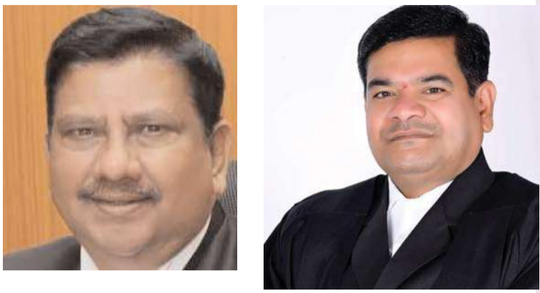
ప్రజా స్వేచ్ఛ హైదరాబాద్