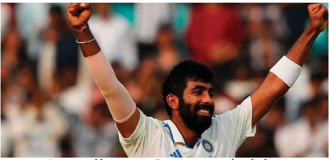
అవుతుందని చెప్పాడు. నొప్పితోనే బువ్రా ఆ ఓవర్ వచ్చినప్పుడు అతని వేలికి టేప్ తో కనిపించింది. పూర్తి చేశాడు. మళ్లీ ఓవర్ బౌలింగ్ చేయడానికి

న్యూజిలాండ్ తో శుక్రవారం జరుగుతున్న తొలి టెస్టు మ్యాచ్ లో భారత ఫాస్ట్ బౌలర్ జస్ప్రిత్ బువ్రా గాయపడ్డాడు. అయితే.. అతనికి గాయం ఎంత తీవ్రంగా ఉందనే దానిపై టీసీసీఐ అవ్ డేట్ ఇవ్వలేదు. ఇప్పటికే.. మోకాలి గాయం కారణంగా రిపబ్లీ పంత్ ఆటకు దూరంగా ఉండటంతో టీమ్ మేనేజ్ మెంట్ లో ఆందోళన పెరిగింది. బువ్రా వేలికి గాయమైనప్పటికీ.. మూడో రోజు లండ్ డ్రైక్ తర్వాత బువ్రా బౌలింగ్ చేశాడు. వేలి నుంచి రక్తం వచ్చినా.. చికిత్స అనంతరం బౌలింగ్ చేశాడు. న్యూజిలాండ్ ఇన్నింగ్స్ 86వ ఓవర్ లో లండ్ తర్వాత ఫిజియో మైదానంలో కనిపించాడు. ఆ తర్వాత భారత మాజీ కెప్టెన్ సునీల్ గవాస్కర్ కామెంట్లీ సమయంలో ఫాస్ట్ బౌలర్ మధ్య వేలు కోసుకుపోయి రక్తస్రావం