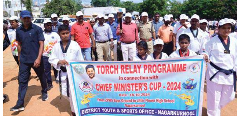
నాగర్ కర్నూల్ వనపర్తి జిల్లా కేంద్రాల్లో సంబరంగా సాగిన క్రీడాజ్యోతి ర్యాలీలు