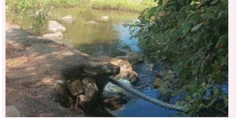
ప్రజా స్వేచ్ఛ అక్టోబర్ 18 గంభీరావుపేట

గంభీరావుపేట మండల కేంద్రంలోని గంభీరావుపేట లింగన్నపేట మధ్యలో వాగు అవతల మద్దుల చెరువు కొమ్ము నుండి వచ్చే జాలు నీళ్ల కోసం ఎప్పుడో పురాతనమైన చిన్న రుద్దామును నిర్మించడం జరిగింది. అట్టి చిన్న బ్రిడ్జి యొక్క కాల పరిమితి ముగిసినందున శిథిలావస్థకు చేరుకోవడం జరిగింది లింగన్నపేటకు వెళ్లేటప్పుడు ఎడమ చేతి వైపు కొంత బ్రిడ్జి కూలిపోయి ప్రమాదకరంగా ఉంది ఎవరన్నా ప్రయాణికులు కరెక్ట్ ఉంది కదా అని ప్రయాణిస్తే అందులో పడి మరణించే అవకాశాలు అనేకం ఉన్నాయి దాని చుట్టూ ఆర్ అండ్ బి అధికారులు కనీస బోర్డులు ఏర్పాటు చేయకపోవడానికి కూడా కారణం ఏమిటో తెలియదు కేవలం నాలుగు రాళ్లు అడ్డు పెట్టడం జరిగింది అట్టి గుంత కనబడకుండా చెట్ల పొద అడ్డుముండడం ద్వారా దగ్గరికి వెళ్లంతవరకు కనిపించని పరిస్థితి కాబట్టి సంబంధిత అధికారులు ప్రమాదం జరగకముందే హెచ్చరిక బోర్డులు హెచ్చరిక బోర్డులు ఏర్పాటు చేసి ప్రజల ప్రాణాలను కాపాడాలని మండల ప్రజలు కోరుతున్నారు