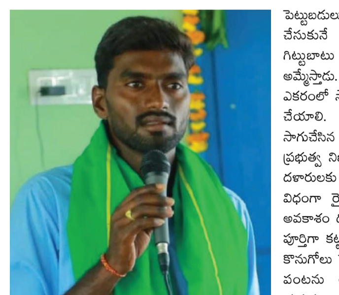
పరిస్థితుల్లో సాగు చేసే సమయంలో అనేక

మునుగోడు అక్టోబర్ 20: ( ప్రజా స్వేచ్ఛ) రైతు పంటతో సాహసం నిరంతరం శ్రమించి సాగు చేసిన పంట చేతికి అందే సమయంలో సకాలంలో వర్షం పడకపోవడం వల్ల పంట చేను వడలిపోయి పంట దిగుబడి రాకపోయి, అనేక వైరస్ ల బారిన బడిన చేదాకా వచ్చిన పంట చేజారిపోయినా రైతులు మరలా పంటతోసాహసం. రైతంగానికి తెలంగాణ రాష్ట్ర వ్యవసాయ శాఖ నూరించిన విధంగా రైతులు రాష్ట్ర వ్యాప్తంగా అధిక సాగు చేసిన రైతంగానికి పత్తి పంట మొదటి తీత మొదలయింది. పత్తి పంట చేతికి అందిన తర్వాత పత్తి కొనుగోలు కేంద్రాలు ఏర్పాటు చేయడం వలన దళారులకు అమ్ముకోవలసినపరిస్థితి ఏర్పడుతుంది. చేతికి అందిన పంట మార్కెట్లో అమ్మే సమయంలో గిట్టుబాటు ధర లేకపోయినా పండించిన పంటను భద్రపరచుకునే అవకాశం లేక, తప్పనిసరి