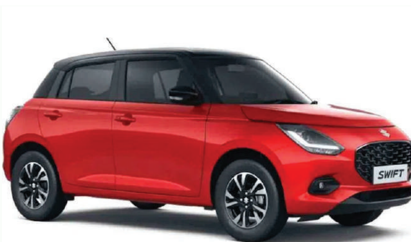
అందచేస్తోంది. ఈ కారు ధర రూ.6.49 లక్షల (ఎక్స్ షోరూమ్) నుంచి రూ.8.02 లక్షల (ఎక్స్ షోరూమ్0

ప్రముఖ కార్ల తయారీ సంస్థ మారుతి సుజుకి ఫెస్టివ్ సీజన్ సందర్భంగా దేశీయ మార్కెట్లోకి తన పాపులర్ హ్యూవర్ బ్యాక్ కారు 'స్విఫ్ట్ బ్లడ్' ఎడిషన్ ఆవిష్కరించింది. స్విఫ్ట్ బ్లడ్ కారు ఐదు వేరియంట్లు - ఎల్ఎక్స్ఐ, వీఎక్స్ఐ, వీఎక్స్ఐ ఎఎంటీ, వీఎక్స్ఐ (ఓ), వీఎక్స్ఐ (ఓ) ఎఎంటీ వేరియంట్లలో లభిస్తుంది. రేర్ అండర్ బాడీ స్పాయిలర్, స్పాయిలర్ ఆన్ బూట్, ఫాగ్ ల్యాంప్స్, ఇల్యూమినేటెడ్ డోర్ సిల్స్, డోర్ విజర్, సైడ్ మార్లింగ్ తదితర ఫీచర్లు ఉంటాయి. లేయర్ వేరియంట్ స్విఫ్ట్ కార్ల విక్రయాలపై రూ.49,884 విలువైన 'బ్లడ్' కిట్