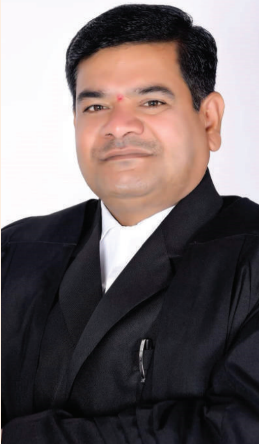
తెలంగాణ న్యాయవాదుల హక్కుల పరిరక్షణ సమితి రాష్ట్ర అధ్యక్షుడు తరిగొప్పుల మహేందర్ ప్రజాపతి ఒక ప్రకటనలో తెలియజేశారు. సిబ్బందిని సర్వీస్ నుంచి తొలగిస్తున్నామని పోలీసు శాఖ (Police Department ) ఓ ప్రెస్ నోట్ విడుదల చేసింది.

ప్రజా స్వేచ్ఛ... 6వ బెటాలియన్ (కొత్తగూడెం)కు చెందిన ఒకరు... 6వ బెటాలియన్ (కొత్తగూడెం)కు చెందిన ఒకరు ఉన్నారు. ఈ మేరకు ఏడీజీ సంజయ్ అధికారిక ఉత్తర్వులు జారీ చేశారు. పోలీసు వృత్తిలో ఉండి ధర్మాలు, ఆందోళనలకు నాయకత్వం వహించారని.. నిరసనలను ప్రేరేపించి క్రమశిక్షణను ఉల్లంఘించారని అందుకే TGSP సిబ్బందిపై ప్రభుత్వం సస్పెన్షన్ వేటు వేసినట్లుగా ఉత్తర్వుల్లో పేర్కొన్నారు. రాజ్యాంగం ( Constitution )లోని ఆర్టికల్ 311 (Article 311) ప్రకారం.. మొత్తం 10 మంది సిబ్బందిని సర్వీస్ నుంచి తొలగిస్తూ చర్యలు తీసుకున్నారు. కాగా, తెలంగాణ స్పెషల్ పోలీస్ ( Telangana Special Police) క్రమశిక్షణను పటిష్టం చేయడానికి ప్రధాన విలువలను నిలబెట్టడానికి, రాష్ట్రం అంతటా అంతటా బహిరంగ ప్రదేశాల్లో అసాధికారిక ఆందోళనలు, సమ్మెల్లో పాల్గొన్నందున కొంతమంది