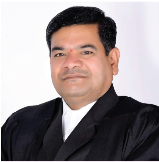
తెలంగాణ న్యాయవాదుల హక్కుల పరిరక్షణ సమితి రాష్ట్ర అధ్యక్షుడు తరిగొప్పుల మహేందర్ ప్రజాపతి రిటైర్డ్ జడ్జి కాంగ్రెస్ నాయకుడు రంగారెడ్డి జిల్లా అధికార ప్రతినిధి