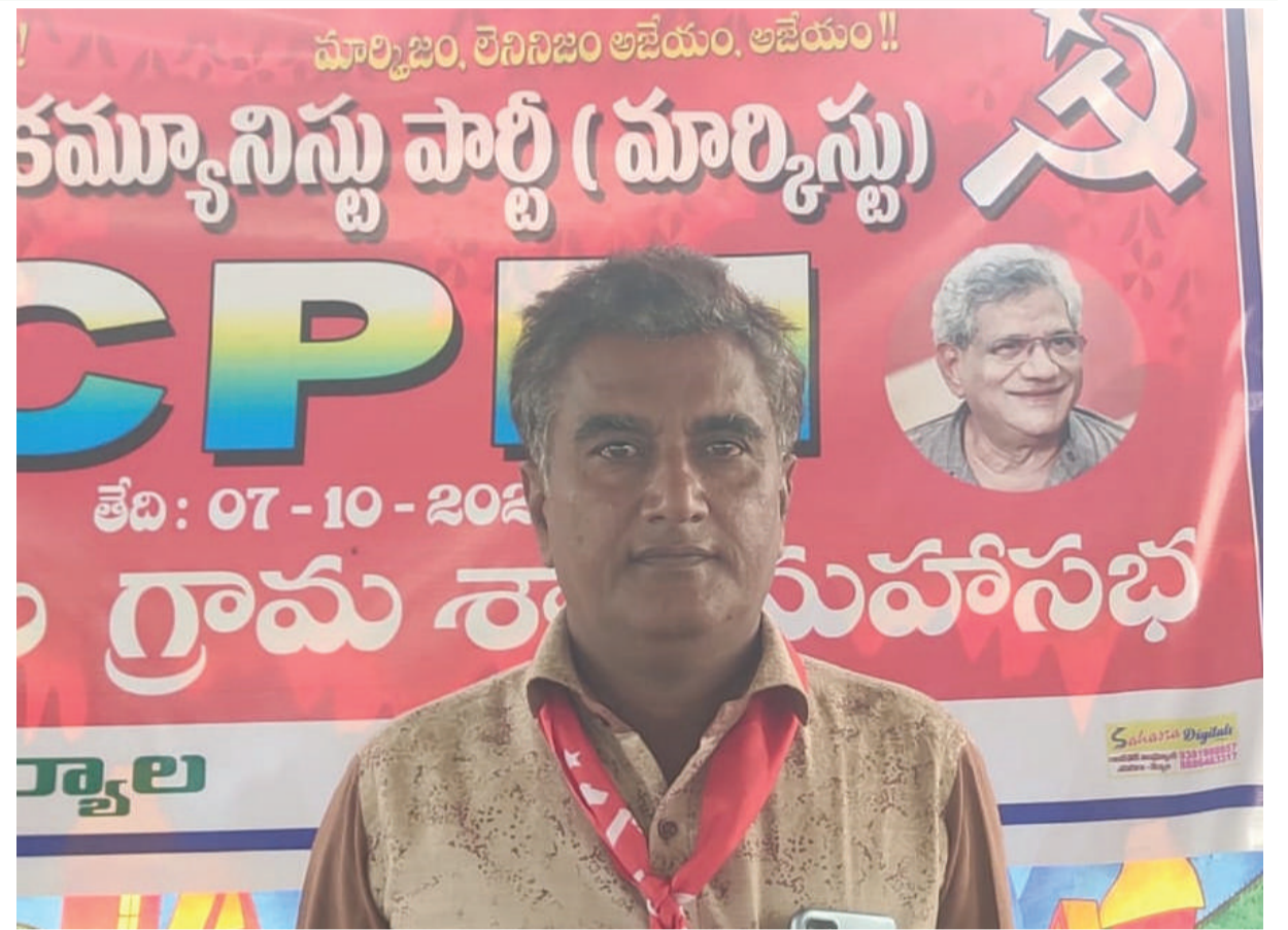
ముస్తాల గ్రామ సిపిఎం పార్టీ రెండవ శాఖ కార్యదర్శిగా ఎండి ఎజాస్ ఎన్నికయ్యారు.