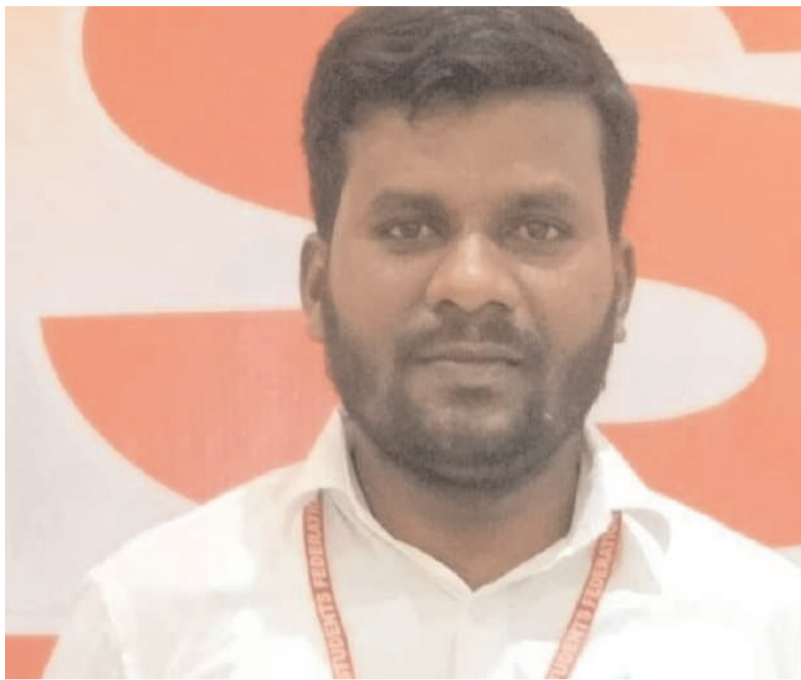
ఉద్యతం చేసి ఎన్నికల ముందు అయినా ఈ ప్రాంతం రెవెన్యూ డివిజన్ గా ప్రకటించబడుతుందని ఆశించాం ఎన్నికలు ముగిసి 10 నెలలు కావస్తున్న ఈ ప్రభుత్వం చేర్యాలపై ఎలాంటి స్పష్టత ఇవ్వలేదు కాబట్టి మరో ఉద్యమానికి మనమంతా సిద్ధం కావలసిన అవసరం ఎంతైనా ఉంది అందరం కలిసికట్టుగా

ప్రజా స్వేచ్ఛ మన చేర్యాల గతంలో ఎంతో వైభవంగా ఉమ్మడి వరంగల్ జిల్లాలో పేరుగాంచిన చరిత్ర గలిగిన ప్రాంతంగా ఉండేది కానీ గత 20 సంవత్సరాల నుండి చేర్యాల ప్రాంతం అన్ని రకాలుగా తన ఉనికిని కోల్పోతుంది దీనికి కారణం మన ప్రాంతం నుండి ఎన్నిక కాబడి కనీసం ఈ ప్రాంతాన్ని అభివృద్ధి చేయాలనే ఆకాంక్షలేని అసమర్థ నాయకుల వల్లనే ముమ్మాటికి ఇది నిజం. గతంలో తెలంగాణ ఉద్యమానికి ఆయు పట్టుగా ఉన్న చేర్యాల నియోజకవర్గాన్ని మనం కోల్పోయాం. అదేవిధంగా ఉమ్మడి వరంగల్ జిల్లా నుండి జిల్లాల బై ఫర్ కేషన్ ద్వారా సిద్దిపేట జిల్లాలో చేర్చిన తర్వాత ఇక్కడి ప్రాంతం ప్రజలు రెవెన్యూ డివిజన్ ఉద్యమాన్ని భుజాన ఎత్తుకున్నారు దాంట్లో జేపీసీగా అందరం అన్ని రాజకీయ పక్షాలు కలిసి ఉద్యమాన్ని ముందుకు నడిపాయి కానీ గత ప్రభుత్వం హామీ ఇచ్చిందే తప్ప ఇక్కడ ప్రాంత ప్రజల మనోభావాలను గౌరవించి రెవెన్యూ డివిజన్ ప్రకటించలేకపోయింది.అదేవిధంగా ఇప్పుడు ఏర్పాటైన ప్రభుత్వం ఇచ్చిన హామీ ప్రకారం చేర్యాలను రెవెన్యూ డివిజన్ కేంద్రంగా ఏర్పాటు చేయాలని నియోజకవర్గాన్ని పునరుద్ధరించాలని ఇక్కడి ప్రజలు కోరుకుంటున్నారు అదే లక్ష్యంతో గత ఏడు సంవత్సరాలుగా అనేక దఫాలుగా జేపీసీగా ఏర్పడి ఉద్యమాలను