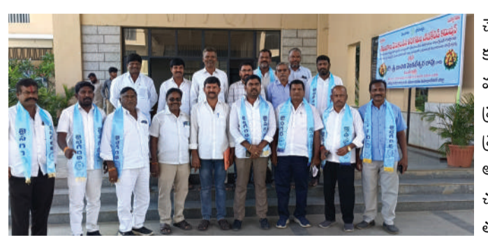
ఉన్నతాధికారులు కుట్రలు చేయడం తోచనియమన్నారు. రాష్ట్ర ప్రభుత్వం చేపట్టిన సమగ్రకుల సర్వే ఫార్మేట్ లో కొన్ని కులాలు మాత్రమే గుర్తించడం,అందులో తమ ఉప్పరి కులాన్ని మాత్రం

వనపర్తి నవంబర్ 18 ప్రజా స్వేచ్ఛ వనపర్తి జిల్లా సగర సంగం నాయకులు కుల సర్వే ఫార్మేట్లో సగర కులాన్ని వృత్తి కులంగా చేర్చకపోవడంపై అభ్యంతరం వ్యక్తం చేశారు.తెలంగాణ రాష్ట్ర ప్రభుత్వం ప్రతిష్టాత్మకంగా చేపట్టిన సమగ్ర కుల సర్వే లో ఆర్థికంగా చతికిలబడిన, రాజకీయంగా రాణించలేక వెనుకబాటుకు గురైన సగర సంగం కులాన్ని చేర్చకపోవడాన్ని తీవ్రంగా ఖండించారు. కొన్ని కులాలకు మాత్రమే పెద్దపీట వేస్తూ అనేక రంగాలలో వెనుకబడిన తమ సగర సంగం లాంటి కులాలను ఇంకా వెనక్కి నెట్టేలా ప్రభుత్వంలో కొనసాగుతున్న