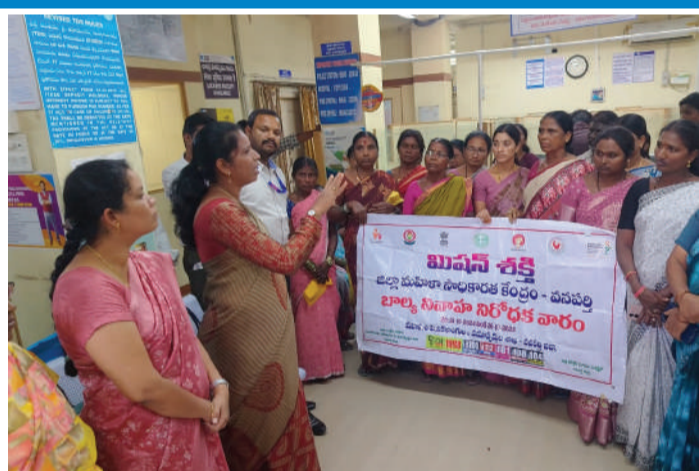
చట్టం, పని చేసే చోట లైంగిక వేదింపులు చట్టం, బాల్య వివాహాలు, పలు పథకాల గురించి కార్యక్రమంలో అవగాహన కల్పించారు. ఈ