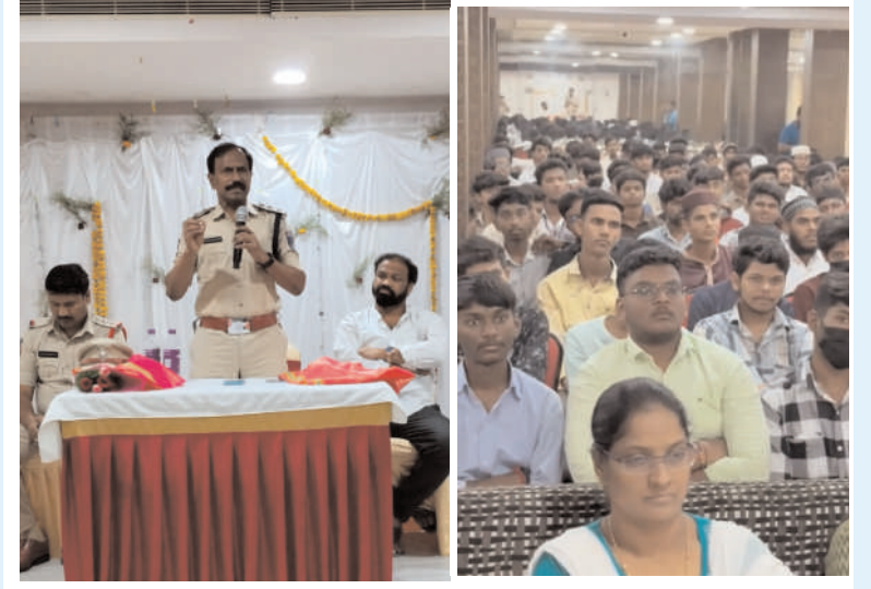
కుత్బుల్లాపూర్ నవంబర్ 22 ప్రజా స్వేచ్ఛ