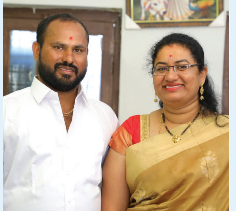
కల్వకుర్తి, నవంబర్ 22 ప్రజా స్వేచ్ఛ