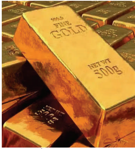
ప్రాంతాల కంటే.. పసిడి ధర గరిష్టంగా ఉంది. 24 క్యారెట్ల బంగారం ధర రూ.7,76,000గా ఉండగా..

ఇటీవల వరకు బంగారం ధరలు భారీగా పెరిగాయి. 24 క్యారెట్ల బంగారం ధర 80 వేల మార్కు ను సైతం దాటింది. కానీ గత కొద్ది రోజులుగా వాటి ధరలు కొద్ది కొద్దిగా తగ్గుతూ దిగి వస్తున్నాయి. ఆదివారం 22 క్యారెట్ల బంగారం 100 గ్రాముల ధర 7,10,000 ఉండగా.. 24 క్యారెట్ల బంగారం 100 గ్రాముల ధర 7,74,500 గా ఉంది. గత వారం కిలో వెండి ధర సైతం రూ. లక్ష మార్కుకు చేరుకొంది. ఇక వెండి ధరను పరిశీలిస్తే.. వాటి ధర సైతం తగ్గుతూ వస్తోంది. ఈ వారం ప్రారంభంలో కిలో వెండి ధర రూ. 99,900 ఉండగా.. నేడు.. అంటే ఆదివారం కిలో వెండి ధర రూ. 99,000గా ఉంది. ఇక హైదరాబాద్లో 24 క్యారెట్ల బంగారం ధర 100 గ్రాములు రూ.7,74,500, 22 క్యారెట్ల బంగారం ధర 100 గ్రాములు రూ.7,10,000గా ఉంది. దేశ రాజధాని న్యూఢిల్లీలో మాత్రం దేశంలోని వివిధ