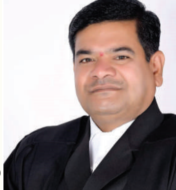
తెలంగాణ న్యాయవాదుల హక్కుల పరిరక్షణ సమితి రాష్ట్ర అధ్యక్షుడు తరిగొప్పుల మహేందర్ ప్రజాపతి రిటైర్డ్ జడ్జి, కాంగ్రెస్ నాయకుడు రంగారెడ్డి జిల్లా అధికార ప్రతినిధి

హైదరాబాద్: ప్రజా స్వేచ్ఛ కొత్త చట్టానికి అసెంబ్లీ ఆమోదం తెలపడంతో పెండింగ్ సాదాబైనామాలకు త్వరలోనే మోక్షం కలుగనుంది. జూన్ 2, 2014 నాటికి తెల్లకాగితాలపై ఒప్పందాల (సాదాబైనామా) ద్వారా జరిగిన కొనుగోళ్లను క్రమబద్ధీకరించాలని ఆర్డీఆర్ -2024 చట్టం సెక్షన్ 6(1) కింద ప్రభుత్వం నిర్ణయం తీసుకుంది. ఈ మేరకు ఆర్డీఆర్ స్థాయిలో విచారణ చేపట్టిన తర్వాత వాటిని క్రమబద్ధీకరణ చేయనున్నారు. ఎన్నో ఏళ్ల క్రితం సాదాబైనామా రూపంలో భూములు కొని అనుభవిస్తున్నా సరైన పత్రాలు లేకపోవడంతో రాష్ట్ర ప్రభుత్వం వారిని రైతులుగా గుర్తించడం లేదు. అయితే వీటిని క్రమబద్ధీకరించడం కోసం గత ప్రభుత్వం దరఖాస్తులు స్వీకరించినా వాటిని పరిష్కరించటంలో విఫలమైంది. తాజాగా ప్రస్తుత ప్రభుత్వం కొత్త ఆర్డీఆర్ చట్టం ద్వారా సాదాబైనామాలకు భూ హక్కులు వర్తింపజేస్తామని వెల్లడించడంతో దరఖాస్తుదారుల్లో కొత్త ఆశలు చిగురిస్తున్నాయి.