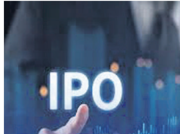
వచ్చాయి. స్టాక్ ఎక్స్చేంజీల సమాచారం ప్రకారం.. 2024లో 90 తొలి పబ్లిక్ ఇష్యూలు వచ్చాయి. మొత్తంగా రూ. 1.6 లక్షల కోట్లు సమీకరించబడ్డాయి. అదనంగా వాడాఫోన్ ఐడియా ఫాలోఆన్ఆఫర్

ప్రస్తుత ఏడాది 2024లో రికార్డ్ స్థాయిలో ఇన్వైయల్ పబ్లిక్ ఆఫర్లు (ఐపీఓ)లు నమోదయ్యాయి. నిధుల సమీకరణలో నూతన మైలురాయిని తాకాయి. అనుకూలమైన మార్కెట్ పరిస్థితుల వల్ల రూ.1.6 లక్షల కోట్ల నిధులు సమీకరించాయి. హ్యూందారు మోటార్ ఇండియా దేశ మార్కెట్లలోనే రికార్డ్ స్థాయిలో రూ.27,870 కోట్ల ఐపీఓతో రికార్డ్ను నమోదు చేసింది. 2023తో పోలిస్తే 2024లో ఐపీఓకు వచ్చిన కంపెనీల సగటు నిధుల సమీకరణ రెట్టింపై రూ.1,700 కోట్లకు చేరింది. గతేడాది ఇష్యూల సగటు మొత్తం రూ.867 కోట్లుగా ఉంది. ప్రస్తుత ఒక్క డిసెంబర్లోనే 15 కంపెనీలు ఐపీఓకు