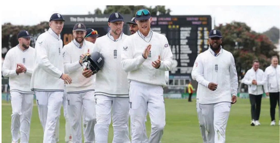
వోక్స్ (2/20), కార్వ్ (2/53) రాజించారు.

న్యూజిలాండ్ పర్యటనలో ఉన్న ఇంగ్లండ్ క్రికెట్ జట్టు పరుగు విజయాలతో టెస్టు సిరీస్ ను 2-0తో సొంతం చేసుకుంది. వెల్లింగ్టన్ వేదికగా ఆదివారం ముగిసిన రెండో టెస్టులో ఐన్ స్ట్రోక్స్ సేన 323 పరుగుల భారీ తేడాతో విజయం సాధించింది. ఆతిథ్య జట్టు ఎదుట 583 పరుగుల కొండంత లక్ష్యాన్ని నిలువగా.. కివీస్ 54.2 ఓవర్లలో 259 పరుగులకే కుప్పకూలింది. టామ్ బ్లండెల్ (115), నాథన్ స్మిత్ (42) మినహా మిగిలినవారంతా విఫలమయ్యారు. అంతకుముందు ఓవర్ నైట్ స్కోరు 378/5తో మూడో రోజు బ్యాటింగ్ కు వచ్చిన ఇంగ్లీష్ జట్టు.. రెండో ఇన్నింగ్స్ లో 427/6 పరుగుల వద్ద డిక్లైర్ చేసింది. రికార్డుల వీరుడు జో రూట్ (106) మరో శతకాన్ని తన ఖాతాలో వేసుకున్నారు. బౌలింగ్ లో స్ట్రోక్స్ (3/5),