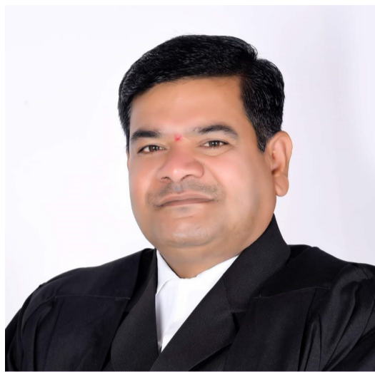
తెలంగాణ న్యాయవాదుల హక్కుల పరిరక్షణ సమితి రాష్ట్ర అధ్యక్షుడు తరిగొప్పుల మహేందర్ ప్రజాపతి రిటైర్డ్ జడ్జి, కాంగ్రెస్ నాయకుడు రంగారెడ్డి జిల్లా అధికార ప్రతినిధి