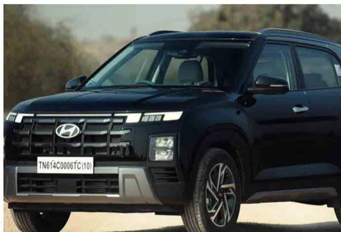
మార్పులు చేశారు. ఫ్రంట్లో బ్లౌంక్ బెట్ గ్రిల్లె విత్ ఏ సెంటర్ మౌంటెడ్ చార్జింగ్ పోర్ట్, రేర్లో రిడిజైన్డ్ ఉంటాయి

దక్షిణ కొరియా ఆటోమొబైల్ మేజర్ హ్యూందాయ్ మోటార్ ఇండియా త్వరలో తన ఎలక్ట్రిక్ ఎన్యూవీ క్రెటా ఈవీ కారును ఆవిష్కరించనున్నది. భారత్ మొబిలిటీ గ్లోబల్ ఎక్స్ పో-2025లో దీన్ని ప్రదర్శించే అవకాశాలు ఉన్నాయి. హ్యూందాయ్ నుంచి భారత్ మార్కెట్లోకి వస్తున్న మూడో ఎలక్ట్రిక్ వెహికల్ ఇది. మార్కెట్ నుంచి ఉపసంహరించిన కోనా ఎలక్ట్రిక్ స్టానంలో క్రెటా ఈవీ వస్తోంది. మార్కెట్లో ఇప్పటికే ఉన్న ఐయూనిక్ 5 తోపాటు టాటా మోటార్స్ ఎలక్ట్రిక్ కార్లకు హ్యూందాయ్ క్రెటా ఈవీ గట్టి సవాల్ విసురుతుందని భావిస్తున్నారు. హ్యూందాయ్ క్రెటా - 2024 మాదిరిగానే హ్యూందాయ్ క్రెటా ఎలక్ట్రిక్ వస్తోంది. ఎలక్ట్రిక్ వర్షన్ కారు కోసం కొన్ని కీలక