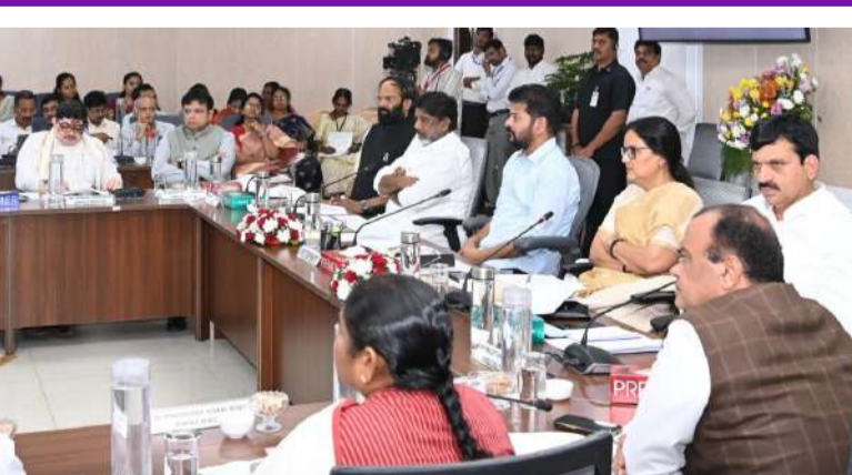
-రైతు భరోసా, ఇందిరమ్మ ఆత్మీయ భరోసా, రేషన్ కార్డుల జారీ, ఇందిరమ్మ ఇండ్ల వంటి కీలకమైన నాలుగు సంక్షేమ పథకాల అమలులో జిల్లా కలెక్టర్ క్రియాశీల పాత్ర పోషించాలని ముఖ్యమంత్రి రేవంత్ రెడ్డి చెప్పారు. డాక్టర్ బీఆర్ అంజెద్గర్ రాష్ట్ర సచివాలయంలో ముఖ్యమంత్రి అధ్యక్షతన జరిగింది. తెలంగాణలోని వ్యవసాయ యోగ్యమైన భూములకు ఎకరారు రూ. 12 వేల చొప్పున రైతు భరోసా చెల్లించాలని, అలాగే, వ్యవసాయానికి పనికి రాని భూములను గుర్తించి వాటిని రైతు భరోసా నుంచి మినహాయించాలని ముఖ్యమంత్రి చెప్పారు. ఇందిరమ్మ ఆత్మీయ భరోసా కింద రూ. 12 వేల చొప్పున చెల్లించాలని, ఈ రెండు పథకాలు జనవరి 26 న రివల్వ్ డే నుంచి అమలు చేయాలని చెప్పారు.