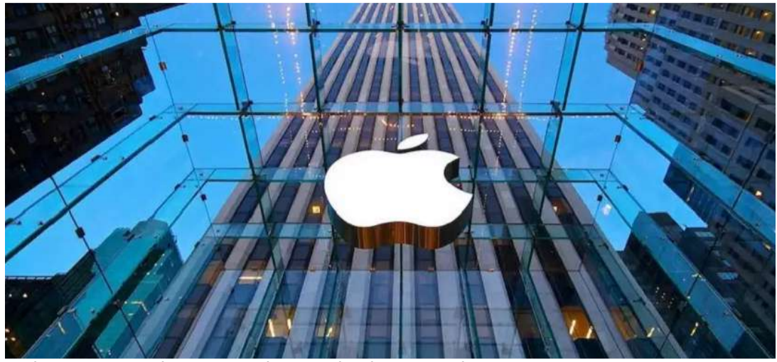
అంతే కాదు, 2025లో టిమ్ కుక్ వేతన ప్యాకేజీలో ఇక వచ్చేనెల 25న ఆపిల్ వార్షిక సర్వ సభ్య ఎటువంటి మార్పులు ఉండబోవని ఆపిల్ తేల్చేసింది. సమావేశం జరుగుతున్నది.

గ్లోబల్ టెక్ దిగ్గజం ఆపిల్ కీలక నిర్ణయం తీసుకున్నది. కంపెనీ సీఈఓ టిమ్ కుక్ వేతనం 18 శాతం పెంచాలని నిర్ణయించింది. కంపెనీ వార్షిక వాటాదారుల సమావేశానికి నెల రోజుల ముందుగా ఆపిల్ బోర్డు ఈ నిర్ణయం తీసుకోవడం గమనార్హం. దీని ప్రకారం 2023లో టిమ్ కుక్ వేతనం 63.2 మిలియన్ డాలర్లు (రూ.544 కోట్లు) నుంచి 2024లో 74.6 మిలియన్ డాలర్లు (రూ.643 కోట్లు)కు పెరిగిందని శుక్రవారం తన వార్షిక ప్రాక్టీ ఫైలింగ్లో ఆపిల్ వెల్లడించింది. టిమ్ కుక్ కనీస వేతనం మూడు మిలియన్ల డాలర్లు కాగా, స్టాక్ అవార్డుల ద్వారా 58.1 మిలియన్ డాలర్లు, అదనపు పరిహారం రూపేణా 13.5 మిలియన్ డాలర్లు.. చెల్లిస్తారు. గతేడాది నుంచి టిమ్ కుక్ వార్షిక వేతనం గణనీయంగా పెరిగింది.