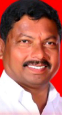
1) కానెడ్ల రాజన్న గారు బాదం చెక్ పోడి నిందిత