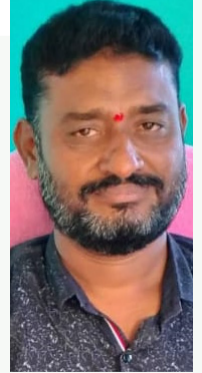
2) ఒల్లాల వరద గౌడ్ గారు మంచిర్యాల జిల్లా పోడి పోడి చెక్ పోడి అభ్యర్థి