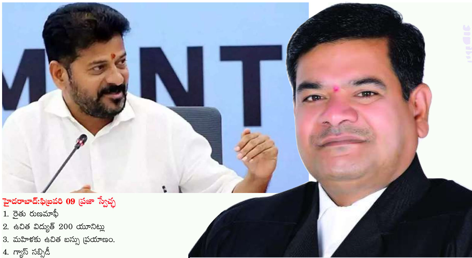
హైదరాబాద్: ఫిబ్రవరి 09 ప్రజా స్వేచ్ఛ