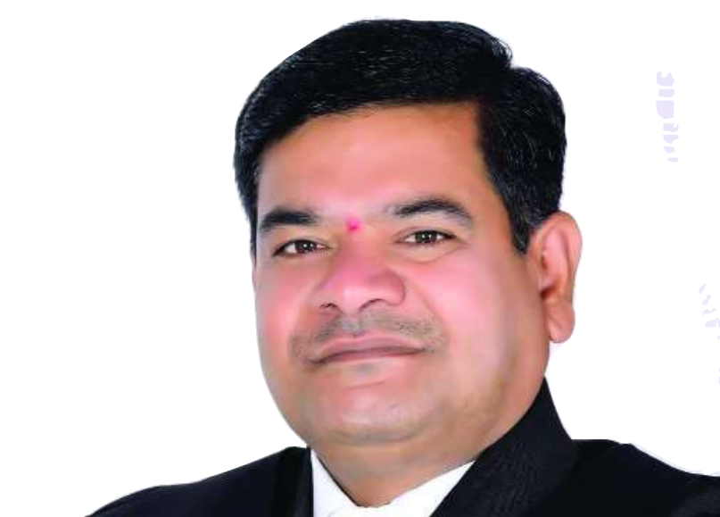
తెలంగాణ న్యాయవాదుల హక్కుల పరిరక్షణ సమితి రాష్ట్ర అధ్యక్షుడు తరిగొప్పుల మహేందర్ ప్రజాపతి రిటైర్డ్ జడ్జి, కాంగ్రెస్ నాయకుడు రంగారెడ్డి జిల్లా అధికార ప్రతినిధి

వర్గాలకు సంక్షేమాన్ని సమర్థవంతంగా అమలు చేస్తున్నాం. ముఖ్యంగా రైతులకు 24 గంటలు ఉచిత విద్యుత్ సరఫరా, ఎకరాకు రూ.12 వేలు రైతు భరోసా, భూమి లేని కుటుంబాలకు ఏడాదికి రూ.12 వేలు ఇందిరమ్మ ఆశ్రీయ భరోసా ఇస్తున్నాం. పంటలకు కనీస మద్దతు ధరతో పాటు క్వింటాకు రూ.500 టోనస్ ఇస్తున్నాం. - దేశంలోనే రైతులకు రూ.2 లక్షల వరకు రుణమాఫీ చేసిన ఏకైక రాష్ట్రం తెలంగాణ. 25 లక్షల రైతు కుటుంబాలకు రూ.21 వేల కోట్ల రుణ మాఫీ చేశాం. - సామాజిక న్యాయం కాంగ్రెస్ పార్టీ విధానం. సమగ్ర కుల సర్వే చేసిన తొలి రాష్ట్రం తెలంగాణ. సుప్రీంకోర్టు తీర్పు మేరకు ఎస్సీ వర్గీకరణను అమలుకు పూనుకున్న తొలి రాష్ట్రం కూడా తెలంగాణే. ఈ అంశాలను అసెంబ్లీలో ప్రవేశపెట్టిన ఫిబ్రవరి 4వ తేదీని ఏటా 'తెలంగాణ సామాజిక న్యాయ దినోత్సవం'గా జరుపుకుంటాం. జనాభా దామాషా ప్రకారం బీసీ, ఎస్సీ, ఎస్టీ, మైనారిటీలకు వనరులు సమకూర్చుతాం. - సుపరిపాలన ఏడాదిలోనే ఎంత మార్పు