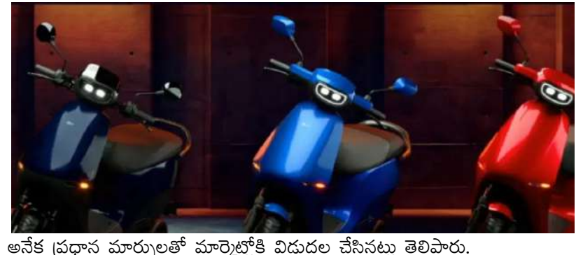
అనేక ప్రధాన మార్పులతో మార్కెట్లోకి విడుదల చేసినట్లు తెలిపారు.

ఓలా ఎలక్ట్రిక్ తన కొత్త థర్డ్ జనరేషన్ ఎలక్ట్రిక్ స్కూటర్ ను శుక్రవారం జనవరి 31న విడుదల చేసింది. తన పోర్ట్ ఫోలియోను విస్తరిస్తూ, కంపెనీ కొత్త శ్రేణితో కూడిన శక్తివంతమైన మోడల్ స్కూటర్ ను విడుదల చేసింది. కంపెనీ ఈ పోర్ట్ ఫోలియోలో మొత్తం నాలుగు వేరియంట్లు ఉన్నాయి. దీని ప్రారంభ ధర రూ. 79,999. దీనితో పాటు, ఓలా తన ఫ్లాగ్ షిప్ ఎలక్ట్రిక్ స్కూటర్ S 1 ప్రో ప్లస్ ను కూడా విడుదల చేసింది. ఇది డ్రైవింగ్ రేంజ్ పరంగా దేశంలోనే అతిపెద్ద ఎలక్ట్రిక్ స్కూటర్ గా మారింది. ఈ ఫ్లాగ్ షిప్ మోడల్ ఒక్కసారి ఛార్జ్ చేస్తే 320 కి.మీ. వరకు ప్రయాణించగలదని కంపెనీ పేర్కొంది. ఈ లాంచ్ గురించి కంపెనీ యజమాని భవిష్యత్ అగర్వాల మాట్లాడుతూ, కొత్తగా విడుదల చేసిన మూడవ తరం స్కూటర్ ను