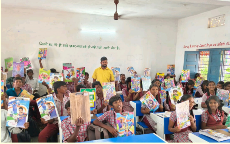
ద్రజా స్వేచ్ఛ ప్రతినిధి రాజాపేట, ఫిబ్రవరి 12