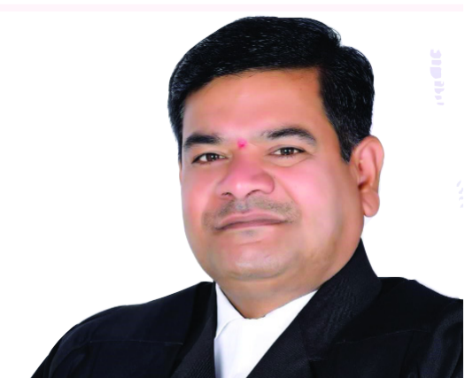
తెలంగాణ న్యాయవాదుల హక్కుల పరిరక్షణ సమితి రాష్ట్ర అధ్యక్షుడు తరిగొప్పుల మహేందర్ ప్రజాపతి రిటైర్డ్ జడ్జి, కాంగ్రెస్ నాయకుడు రంగారెడ్డి జిల్లా అధికార ప్రతినిధి

భూములకు ఎకరానికి రూ.6 వేల చొప్పున రైతు భరోసా నిధులు జమ చేసినట్లు ప్రభుత్వం ప్రకటన చేసింది. జనవరి 26న ఈ రైతు భరోసా పథకం కింద ప్రభుత్వ నిధుల జమను ప్రారంభించింది. ఫిబ్రవరి 5న 17.03 లక్షల మందికి, ఫిబ్రవరి 10న 8.65 లక్షల మందికి విదతల వారీగా నిధులు జమ చేసినట్లు ప్రకటించింది. కాగా ఇప్పటివరకు 2 ఎకరాల లోపు ఉన్న 34 లక్షల మంది రైతుల ఖాతాల్లో రూ. 2200 కోట్లు జమ చేసింది. మొత్తంగా 37 లక్షల ఎకరాలకు పెట్టుబడి సాయం నగదును జమ చేసినట్లు ప్రభుత్వం ప్రకటనలో తెలిపింది.