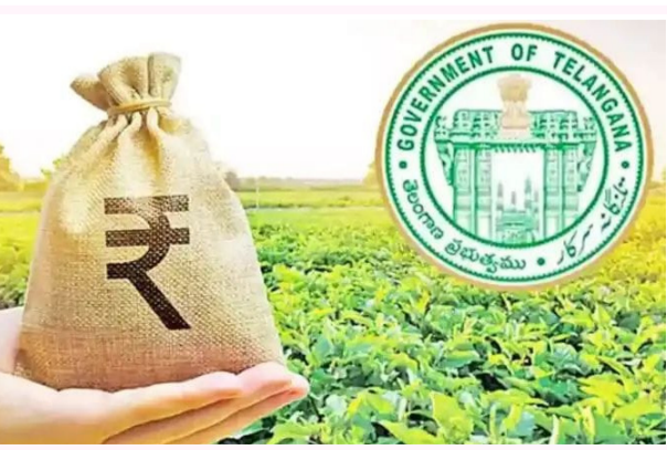
ద్రజా స్వేచ్ఛ హైదరాబాద్ తెలంగాణలో రైతులకు రాష్ట్ర ప్రభుత్వం గుడ్ న్యూస్ చెప్పింది. మూడు ఎకరాల వరకు సాగులో ఉన్న

భూములకు ఎకరానికి రూ.6 వేల చొప్పున రైతు భరోసా నిధులు జమ చేసినట్లు ప్రభుత్వం ప్రకటన చేసింది. జనవరి 26న ఈ రైతు భరోసా పథకం కింద ప్రభుత్వ నిధుల జమను ప్రారంభించింది. ఫిబ్రవరి 5న 17.03 లక్షల మందికి, ఫిబ్రవరి 10న 8.65 లక్షల మందికి విదతల వారీగా నిధులు జమ చేసినట్లు ప్రకటించింది. కాగా ఇప్పటివరకు 2 ఎకరాల లోపు ఉన్న 34 లక్షల మంది రైతుల ఖాతాల్లో రూ. 2200 కోట్లు జమ చేసింది. మొత్తంగా 37 లక్షల ఎకరాలకు పెట్టుబడి సాయం నగదును జమ చేసినట్లు ప్రభుత్వం ప్రకటనలో తెలిపింది.