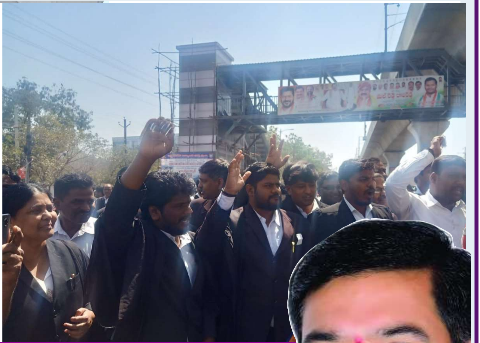
నిరసన చేస్తున్న న్యాయవాదులు