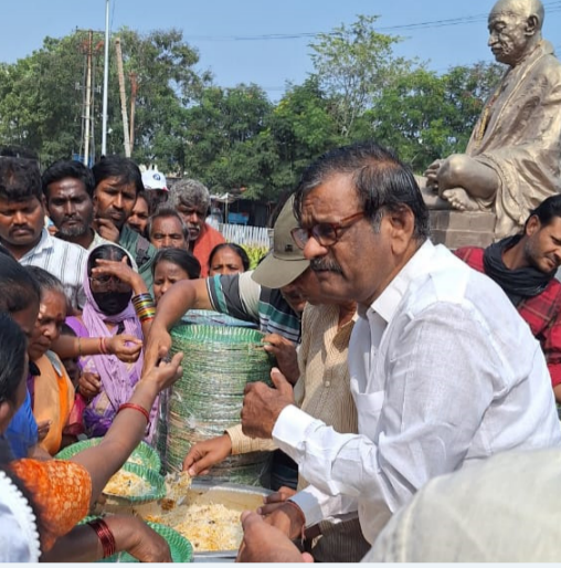
ప్రజా స్వేచ్ఛ ఫిబ్రవరి 17 గ్రేటర్ హైదరాబాద్ ప్రతినిధి వైఎస్ఆర్సీపీ సిద్దిపేట జిల్లా అధ్యక్షుడు ప్రవచ ఆర్యవైశ్య మహానభ ఉపాధ్యక్షుడు తడక

- గాంధీ ఆసుపత్రి దగ్గర అన్నదాన కార్యక్రమం