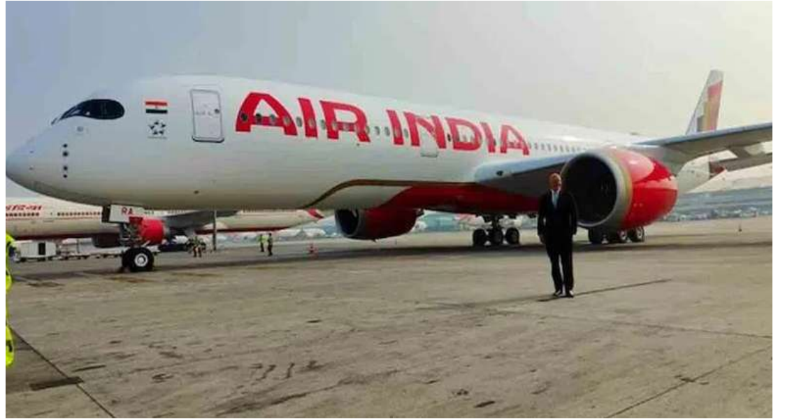
అలర్జిలను పట్టించుకోవడం లేదని డీజీసీఏ తన ఇండియాపై రూ.30 లక్షల పెనాల్టీ విధిస్తున్నట్లు ఆదేశాల్లో పేర్కొంది. దీంతో ఎయిర్ ట్రాస్ట్ రూల్స్ తెలిపింది. 1937లోని 162వ నిబంధన కింద ఎయిర్

టాటా సన్స్ గ్రూప్ ఆధ్వర్యంలోని ఎయిర్ ఇండియాపై పౌర విమానయాన నియంత్రణ సంస్థ డీజీసీఏ రూ.30లక్షల పెనాల్టీ విధించింది. రెగ్యులేటరీ నిబంధనలను పూర్తి చేయకుండానే ఒక ఫైలీను విమానం నడిపేందుకు ఎయిర్ ఇండియా అనుమతించిందని డీజీసీఏ విచారణలో తేలింది. గతేడాది జూలై ఏడో తేదీన ఒక ఫైలీ తప్పనిసరిగా పాటించాల్సిన రెగ్యులేటరీ నిబంధనలను ఉల్లంఘించి మూడు విమానాల బేకాప్, లాండింగ్ చేశాడని డీజీసీఏ పేర్కొంది. ఇది సివిల్ ఏవియేషన్ రిక్వైర్మెంట్ నిబంధనలు- పేరా 3ని ఉల్లంఘించడమేనని స్పష్టం చేసింది. ఈ విషయమై గత నెల 13న జారీ చేసిన షోకాజ్ నోటీసుకు ఎయిర్ ఇండియా ఇచ్చిన జవాబు సంతృప్తికరంగా లేదని డీజీసీఏ తెలిపింది. ఇక ఎయిర్ ఇండియా యాజమాన్యం సీఎక్ విండో పన్నును పలు