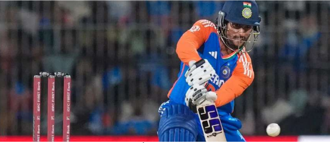
బెన్ డకెట్ కుడా ఎక్కువ సేపు క్రీజులో బోర్డును 150 పరుగుల మార్కును దాటించాడు. నిలబడలేకపోయాడు. ఈ దశలో కెప్టెన్ జోస్ బట్లర్ (45) నిలబడ్డాడు. ఇతర బ్యాట్లర్ల సాయంతో స్కోరు

చెన్నై వేదికగా ఇంగ్లండ్ తో ఉత్తర భారతం సాగిన రెండో టీ20 మ్యాచ్ లో భారత్ విజయం సాధించింది. 2 వికెట్ల తేడాతో ఇంగ్లండ్ పై భారత్ గెలుపొందింది. ఈ మ్యాచ్ లో ఇంగ్లండ్ స్కోర్ 165/9 కాగా, భారత్ స్కోర్ 166/8. ఐదు టీ20ల సిరీస్ లో 2-0 భారత్ ఆధిక్యం. తిలక్ వర్మ 55 బంతుల్లో 72 పరుగులు చేశారు. ఇక ఇంగ్లండ్ బ్యాటింగ్ లో బట్లర్ 45, కార్నే 31 పరుగులు చేశారు. చెన్నైలోని చెపాక్ స్టేడియంలో శనివారం జరుగుతోన్న మ్యాచ్ లో భారత్ విజయం సాధించింది. ఈ టార్గెట్ ను భారత్.. 8 వికెట్లు కోల్పోయి 19.2 ఓవర్లలో ఛేదించింది. ఈ మ్యాచ్ లో టాప్ ఓడి బ్యాటింగ్ కోసం రంగంలోకి దిగిన ఇంగ్లండ్ కు అర్షద్ సింగ్ పాక్ ఇచ్చాడు. తొలి ఓవర్ లోనే ఫిలిప్ హాల్స్ ను ఔట్ చేశాడు. మరో ఓవర్