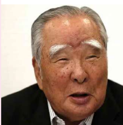
విభాషణ్ పురస్కారాన్ని కేంద్రం ప్రకటించింది.

భారత గణతంత్ర దినోత్సవం సందర్భంగా కేంద్ర ప్రభుత్వం శనివారం పద్మ పురస్కారాలు ప్రకటించింది. వాటిలో ఎనిమిది మంది పారిశ్రామిక వేత్తలు, బ్యాంకింగ్ నిపుణులకు పద్మ పురస్కారాలు అందిస్తామని తెలిపింది. జపాన్ కు చెందిన ప్రముఖ ఆటోమొబైల్ కంపెనీ సుజాకి వ్యవస్థాపకులు ఒసాము సుజాకి (మరణానంతరం)కి పద్మ