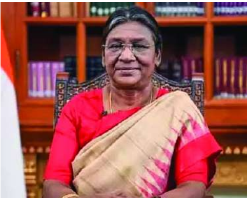
Sri Anumula Revanth Reddy

గతంలో హామీ ఇచ్చిన విధంగా ఆదివారం నుంచి నాలుగు కొత్త పథకాలు ప్రారంభిస్తామని తెలంగాణ సీఎం రేవంత్ రెడ్డి తెలిపారు. రైతు భరోసా, ఇందిరమ్మ ఆత్మీయ భరోసా, ఇందిరమ్మ ఇళ్లు, రేషన్ కార్డుల పంపిణీ పథకాలను ప్రారంభించనున్నట్లు చెప్పారు. ఇంటిగ్రేటెడ్ కమాండ్ -మిగతా 3 లో