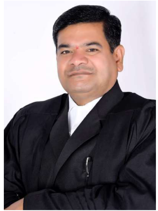
తెలంగాణ న్యాయవాదుల హక్కుల పరిరక్షణ సమితి రాష్ట్ర అధ్యక్షుడు తరిగొప్పుల మహేందర్ ప్రజాపతి రిటైర్డ్ జడ్జి కాంగ్రెస్ నాయకుడు రంగారెడ్డి జిల్లా అధికార ప్రతినిధి

రైతు భరోసా వధకం నేడు రాష్ట్రవ్యాప్తంగా ప్రారంభం కానుంది. అర్జున రైతులకు ఎకరాల ప్రకారం పెట్టుబడి సాయం ఇవ్వాలనే వారి వారి ఖాతాల్లో నేరుగా జమ కానుంది. ఆదివారం గణతంత్ర వేడుకల సందర్భంగా రాష్ట్రంలోని అన్ని గ్రామాల్లో కొత్త రేషన్ కార్డులు, ఇందిరమ్మ ఇళ్లు స్థానిక ప్రజాప్రతినిధులు అధికారులతో కలిసి ప్రారంభించారు. కొత్తగా పట్టాదారు పాసు పుస్తకాలు పొందడం, గతంలో బ్యాంక్ ఖాతా సంబంధం, ఐఎఫ్ఎస్?సీ కోడ్ తప్పవడం, ఖాతా నిర్వహణ లేకపోవడం వంటి సమస్యలతో వేలాది మందికి రైతుబంధు నిలిచిపోయేది. ఇప్పుడా సమస్యల్ని సరిచేసుకొని సంబంధిత పత్రాలను క్లెయర్ చేయడం విస్తరణాధికారుల వద్ద సమర్పించే దుకు ఈ నెలాఖరు వరకు ప్రభుత్వం అవకాశం కల్పిస్తోంది. ఈ వివరాలను పరిశీలించి అర్హులకు పెట్టుబడి సాయం అందించనున్నట్లు అధికారులు తెలిపారు. ఈ చిట్టా రెండు మూడు రోజుల్లో సిద్ధం : ఇటీవలే రాష్ట్రంలో గ్రామాల వారీగా చేపట్టిన సర్వేలో సంబంధ వారీగా సాగుకు పనికొచ్చిన భూములను గుర్తించారు. ఆ విస్తీర్ణం వివరాలను వ్యవసాయ శాఖ అధికారులు పోర్టల్ నుంచి తీసివేస్తున్నారు. ప్రస్తుతం ఈ ప్రక్రియ కొనసాగుతుంది. తహసీల్దార్లు, సీసీఎల్ఏకు చెందిన జాబితాలోనూ ఈ వివరాలు పొందుపరుస్తున్నారు. కేవలం సేద్యం చేయడం లేదని మాత్రమే జాబితాలో పేర్కొంటారు కానీ పట్టా భూముల వివరాలలో ఎలాంటి తేడాలు ఉండవు. ఒకే సర్వే