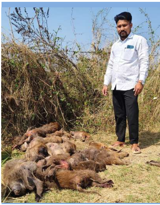
దోషులను కఠినంగా శిక్షించాలని వారు డిమాండ్ చేశారు. ఇలాంటి మూగజీవాలపై హత్యాకాండ కొనసాగిస్తున్న వారిని గుర్తించి వారిని కఠినంగా శిక్షించాలని కోరారు. కోతులు మిరప తోటలను