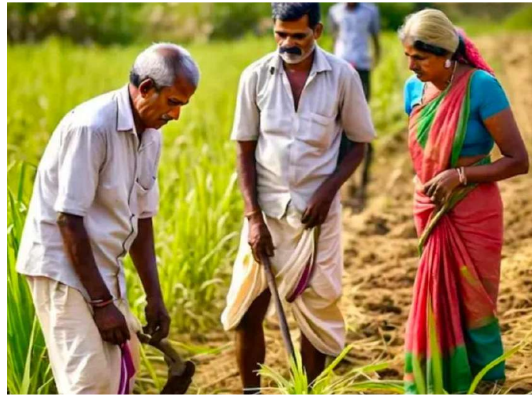
హైదరాబాద్: ప్రజా స్వేచ్ఛ

రైతు భరోసా వధకం నేడు రాష్ట్రవ్యాప్తంగా ప్రారంభం కానుంది. అర్జున రైతులకు ఎకరాల ప్రకారం పెట్టుబడి సాయం ఇవ్వాలనే వారి వారి ఖాతాల్లో నేరుగా జమ కానుంది. ఆదివారం గణతంత్ర వేడుకల సందర్భంగా రాష్ట్రంలోని అన్ని గ్రామాల్లో కొత్త రేషన్ కార్డులు, ఇందిరమ్మ ఇళ్లు స్థానిక ప్రజాప్రతినిధులు అధికారులతో కలిసి ప్రారంభించారు. కొత్తగా పట్టాదారు పాసు పుస్తకాలు పొందడం, గతంలో బ్యాంక్ ఖాతా సంబంధం, ఐఎఫ్ఎస్?సీ కోడ్ తప్పవడం, ఖాతా నిర్వహణ లేకపోవడం వంటి సమస్యలతో వేలాది మందికి రైతుబంధు నిలిచిపోయేది. ఇప్పుడా సమస్యల్ని సరిచేసుకొని సంబంధిత పత్రాలను క్లెయర్ చేయడం విస్తరణాధికారుల వద్ద సమర్పించే దుకు ఈ నెలాఖరు వరకు ప్రభుత్వం అవకాశం కల్పిస్తోంది. ఈ వివరాలను పరిశీలించి అర్హులకు పెట్టుబడి సాయం అందించనున్నట్లు అధికారులు తెలిపారు. ఈ చిట్టా రెండు మూడు రోజుల్లో సిద్ధం : ఇటీవలే రాష్ట్రంలో గ్రామాల వారీగా చేపట్టిన సర్వేలో సంబంధ వారీగా సాగుకు పనికొచ్చిన భూములను గుర్తించారు. ఆ విస్తీర్ణం వివరాలను వ్యవసాయ శాఖ అధికారులు పోర్టల్ నుంచి తీసివేస్తున్నారు. ప్రస్తుతం ఈ ప్రక్రియ కొనసాగుతుంది. తహసీల్దార్లు, సీసీఎల్ఏకు చెందిన జాబితాలోనూ ఈ వివరాలు పొందుపరుస్తున్నారు. కేవలం సేద్యం చేయడం లేదని మాత్రమే జాబితాలో పేర్కొంటారు కానీ పట్టా భూముల వివరాలలో ఎలాంటి తేడాలు ఉండవు. ఒకే సర్వే