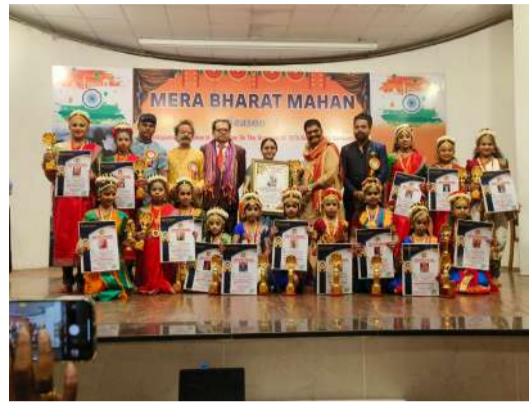
ప్రజా స్వేచ్ఛ ఫిబ్రవరి 02 కూకట్ పల్లి ప్రతినిధి