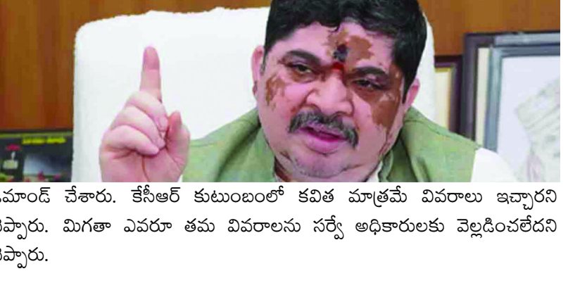
డిమాండ్ చేశారు. కేసీఆర్ కుటుంబంలో కవిత మాత్రమే వివరాలు ఇచ్చారని చెప్పారు. మిగతా ఎవరూ తమ వివరాలను సర్వే అధికారులకు వెల్లడించలేదని చెప్పారు.

చెప్పారు. సర్వేకు వెళ్లిన అధికారులపై కుక్కలను వదిలారని, సర్వే సజావుగా సాగదీయకుండా అనేక అడ్డంకులు సృష్టించారని పొన్నం గుర్తు చేశారు. అప్పుడు సర్వేలో పాల్గొనని వాళ్లు మళ్లీ వివరాలు ఇచ్చేందుకు అవకాశం ఇస్తున్నట్లు మంత్రి చెప్పారు. కులగణన సర్వేపై తప్పుడు వార్తలను వ్యాపింపజేయడం అంటే అది బలహీనపర్గాలపై దాడే అవుతుందని చెప్పారు. ప్రతిపక్షాల అడ్డంకులను ఎదుర్కొంటామని మంత్రి చెప్పారు. దీర్ఘకాలంగా పెండింగ్ లో ఉన్న కులగణన సమస్యను పరిష్కరించామని అన్నారు. బీసీ రిజర్వేషన్లపై ప్రతి రాజకీయ పార్టీ స్టాండ్ చెప్పాలని మంత్రి డిమాండ్ చేశారు. సమగ్ర కులగణన సర్వే చేపట్టిన కేసీఆర్.. ఇప్పటి వరకు ఆ వివరాలను బయటపెట్టలేదని పొన్నం ప్రభాకర్ గుర్తు చేశారు. పదేండ్ల పాటు సమాచారాన్ని దాచిన ఆయన ప్రజలకు క్షమాపణ చెప్పాలని చెప్పారు.