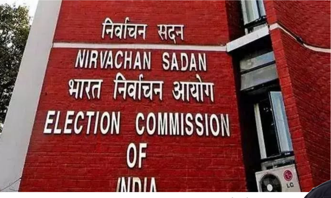
హైదరాబాద్ ప్రజా స్వేచ్ఛ

తెలంగాణలో ఎమ్మెల్యే ఎన్నికల సందడి వాతావరణం మొదలైంది. తెలంగాణలో మూడు ఎమ్మెల్యే స్థానాలు, ఏపీలో మూడు ఎమ్మెల్యే స్థానాలకు కేంద్ర ఎన్నికల కమిషన్ ఇప్పటికే షెడ్యూల్ విడుదల చేసింది. ఈ క్రమంలోనే ఇవాళ ఎమ్మెల్యే ఎన్నికల నోటిఫికేషన్ విడుదల కానుంది. ఇందులో భాగంగా నేటి నుంచి నామినేషన్లు (ప్రక్రియ మొదలు కానుంది. నామినేషన్ల స్వీకారానికి ఈ నెల 10 తుది గడువుగా నిర్ణయించారు. ఉదయం 10 గంటల నుంచి మధ్యాహ్నం 3 గంటల వరకు రిటర్నింగ్ అధికారులు నామినేషన్లను స్వీకరిస్తారు. అనంతరం ఈ నెల 11వ తేదీన నామినేషన్లను పరిశీలిస్తారు. 13వ తేదీన నామినేషన్ల ఉపసంహరణ కు అవకాశం ఉంటుంది. ఇదే నెల 27వ పోలింగ్ నిర్వహించి, మార్చి 3న ఓట్ల లెక్కింపు నిర్వహించనున్నారు. తెలంగాణలో మెదక్-నిజామాబాద్- ఆదిలాబాద్- కరీంనగర్ టీచర్ ఎమ్మెల్యే స్థానానికి, అదే స్థానంలో గ్రాడ్యుయేట్ ఎమ్మెల్యే స్థానానికి, అలాగే వరంగల్- ఖమ్మం- నల్గొండ టీచర్ ఎమ్మెల్యే స్థానాలకు ఎన్నికలు