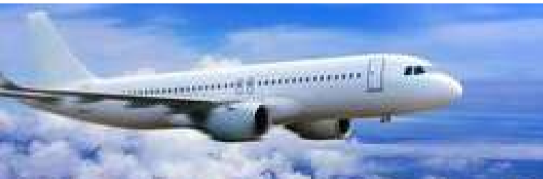
హైదరాబాద్, ప్రజా స్వేచ్ఛ

శంషాబాద్ లోని రాజీవ్ గాంధీ ఇంటర్నేషనల్ ఎయిర్ పోర్ట్ లో నాలుగు అంతర్జాతీయ విమానాలు ల్యాండ్లింగ్ అయ్యాయి. వాతావరణం అనుకూలించకపోవడంతో వాటిని ఇక్కడే ల్యాండ్ చేశారు. చెన్నై ఎయిర్పోర్ట్ లో వాతావరణం అనుకూలించకపోవడం కారణంగా అక్కడికి వెళ్లే విమానాలను శంషాబాద్ ఎయిర్ పోర్ట్ కు దారి మళ్లించారు. ఈ క్రమంలో.. సింగపూర్- చెన్నై, చెన్నై-సింగపూర్, లండన్- చెన్నై, ముంబయి-చెన్నై విమానాలను శంషాబాద్ ఎయిర్ పోర్ట్ లో ల్యాండ్లింగ్ చేశారు. ఉదయం 7 గంటల నుండి చెన్నైలో దట్టమైన పొగమంచు కురుస్తోంది. ఈ క్రమంలో చాలా విమానాలను ఇతర ఎయిర్ పోర్టుకు దారి మళ్లించారు అధికారులు. ఈ క్రమంలో వేలాది మంది ప్రయాణికులు ఇబ్బందులు ఎదుర్కొంటున్నారు. ఉదయం చెన్నై విమానాశ్రయంలో ఖతార్ ఎయిర్వేస్ కార్గో విమానం ల్యాండ్లింగ్ ప్రయత్నం విఫలం కావడంతో బెంగళూరు ఎయిర్ పోర్టుకు మళ్లించారు. మరోవైపు.. పొగమంచు కారణంగా దృశ్యమానత తక్కువగా ఉందని, రన్ వేను చూడటం కష్టమవుతుందని చెన్నై విమానాశ్రయ అధికారులు తెలిపారు. భద్రతా కారణాల దృష్ట్యా విమానాలను దారి మళ్లించామని చెబుతున్నారు. ప్రయాణికులకు కలిగిన అసౌకర్యానికి అధికారులు విచారం వ్యక్తం చేశారు.