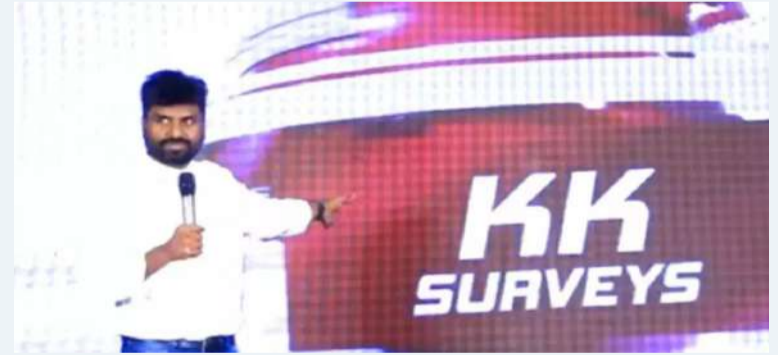
న్యూఢిల్లీ, ప్రజా స్వేచ్ఛ

తెలుగు రాష్ట్రాల్లో పొలిటికల్ సర్వేల్లో అనూహ్యంగా దూసుకొచ్చిన కేకే సర్వే మరోమారు విఫలం అయ్యింది. ఓటరు నాడీ పట్టుకోవడంలో తడబడింది. ఏపీ ఎన్నికల ఫలితాల తర్వాత అతను ఓ ట్రెండ్.. ఎవరూ ఊహించని విధంగా అతను చెప్పినట్లే వైసీపీ సీట్లు రావటం అనేది సంవలనంగా మారింది. ఆ తర్వాత నుంచి కేకే సర్వేపై అంచనాలు భారీగా పెరిగాయి. హర్యానా ఫలితాలు భిన్నంగా వచ్చినా.. మహారాష్ట్రలో మాత్రం అతని ఎగ్జిట్ పోల్ సర్వే నిజం అయ్యింది. ఇప్పుడు ఢిల్లీ అసెంబ్లీ ఎన్నికల ఫలితాలు కేకే ఎగ్జిట్ పోల్ కు భిన్నంగా వచ్చాయి. రివర్స్ అయ్యాయి. ఎగ్జిట్ పోల్ లో ఆమ్ పార్టీ 44 సీట్లు.. బీజేపీ 26 సీట్లలో విజయం సాధిస్తుందని చెప్పగా.. ఫలితాలు మాత్రం వేరుగా వచ్చాయి. బీజేపీ 48 స్థానాల్లో, ఆమ్ 22 సీట్లలో గెలుపొందింది. కేకే ఎగ్జిట్ పోల్ సర్వే క్లయిట్ ఆపోజిట్ లో ఎన్నికల ఫలితాలు రావటం విశేషం. ఏడాది కాలంలో కేకే సర్వే ఫలితాలు రెండు రాష్ట్రాల్లో ఆయన చెప్పినట్లు జరిగితే.. మరో రెండు రాష్ట్రాల్లో మాత్రం రివర్స్ అయ్యాయి. ఏపీ, మహారాష్ట్ర ఫలితాలు కేకే సర్వే నిజం అయితే.. హర్యానా, ఢిల్లీలో మాత్రం తప్పయ్యాయి. మొత్తానికి ఢిల్లీ ఫలితాలు మాత్రం కేకే సర్వేకు వ్యతిరేకంగా రావటం చర్చనీయాంశం అయ్యింది. కేకే సర్వే 50 శాతం మాత్రమే నిజం.. టొమ్మ టొమ్మ అన్నట్లు ఉంటుందని కొందరు నెటిజన్లు కామెంట్స్ చేస్తున్నారు.