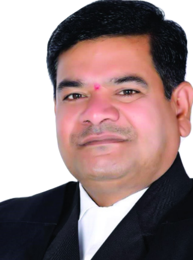
తెలంగాణ న్యాయవాదుల హక్కుల పరిరక్షణ సమితి రాష్ట్ర అధ్యక్షుడు తరిగొప్పుల మహేందర్ ప్రజాపతి రిటైర్డ్ జడ్జి, కాంగ్రెస్ నాయకుడు రంగారెడ్డి జిల్లా అధికార ప్రతినిధి

పీఎం కిసాన్ 19వ విడత నిధులను కేంద్ర ప్రభుత్వం రేపు లబ్ధిదారుల ఖాతాల్లో జమచేయనుంది. బీహెచ్ఐని భాగల్పూర్లో జరిగే కార్యక్రమంలో పీఎం నరేంద్ర మోడీ నిధులు విడుదల చేస్తారు. దేశంలోని 9.8 కోట్ల మంది రైతుల ఖాతాల్లో రూ.22 వేల కోట్లు జమ చేయనున్నారు. కాగా తెలుగు రాష్ట్రాలకు చెందిన దాదాపు 70 లక్షలకుపైగా రైతులకు ఈ పథకం ద్వారా లబ్ధి చేకూరనుంది. రూ.1,460 కోట్లకుపైగా నిధులు విడుదల కానున్నాయి.