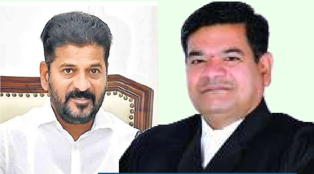
ఉంటుందని ముఖ్యమంత్రి భరోసా ఇచ్చారు.

హైదరాబాద్, ప్రజా స్వేచ్ఛ ఎస్ఎల్బీసీ టన్నెల్ వద్ద జరిగిన ప్రమాదంపై సీఎం రేవంత్ రెడ్డి దిగ్భ్రాంతి వ్యక్తం చేశారు. తక్షణమే రక్షణ చర్యలు చేపట్టాలని అధికారులను ఆదేశించారు. జిల్లా కలెక్టర్, ఎస్పీ, అగ్నిమాపక శాఖ, హైద్రా, ఇరిగేషన్ విభాగం అధికారులు వెంటనే ఆకడికి చేరుకొని సహాయక చర్యలు అందించాలని సీఎం సూచించారు. ప్రమాదంలో గాయపడ్డ వారికి మెరుగైన వైద్య సాయం అందించాలని పేర్కొన్నారు. బాధిత కుటుంబాలకు ప్రభుత్వం అండగా