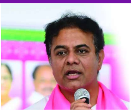
కాంగ్రెస్ సర్కారుకన్నా రూ.600 కోట్లు ఎక్కువ ఖర్చుచేసిన బీఆర్ఎస్ ప్రభుత్వంపై బురదజల్లడం ఈ

నాలుగు రోజులు కాకముందే ఎనిమిది మంది అమాయకుల నిండు ప్రాణాలను ఫణంగా పెట్టిన పాపం ముఖ్యమంత్రిదేనని చెప్పారు. మొత్తం సారంగం 43.94 కిలోమీటర్లయితే, 2005-2014 వరకున్న గత కాంగ్రెస్ సర్కారు హయాంలో తవ్వించి కేవలం 22.89 కిలోమీటర్ల అన్నారు. సారంగంలో క్షిప్రమైన పరిస్థితులున్నా ఏ ప్రమాదం జరగకుండా ఏకంగా 12 కిలోమీటర్ల మేర టన్నెల్ పనులు పూర్తి చేసిన చరిత్ర బీఆర్ఎస్ ప్రభుత్వానిదని తెలిపారు. నాటి కాంగ్రెస్ ప్రభుత్వంలో ఎన్ఎల్బీసీ పనులకు రూ.3300 కోట్ల ఖర్చుచేస్తే, బీఆర్ఎస్ పాలనలో రూ.3900 కోట్ల పనులు పూర్తిచేసిన వాస్తవాన్ని దాచే ప్రయత్నంలో ముఖ్యమంత్రి బొక్కబోర్లా పద్దారని ఎద్దేవాచేశారు. గత