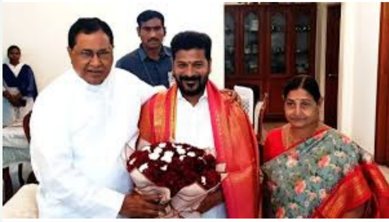
హైదరాబాద్, ప్రజా స్వేచ్ఛ

తాజా రాజకీయాల నేపథ్యంలో అనూహ్యంగా సీఎం రేవంత్ రెడ్డి.. కాంగ్రెస్ సీనియర్ నేత, మాజీ మంత్రి జానారెడ్డి నివాసానికి వెళ్లారు. ఈ సందర్భంగా సుమారు అరగంటకు పైగా వీరి మధ్య పలు అంశాలపై చర్చ జరిగినట్లు తెలుస్తోంది. అయితే జానారెడ్డితో సీఎం రేవంత్ భేటీపై ప్రభుత్వ వర్గాలలో ఆసక్తికర చర్చ నడుస్తోంది. జానారెడ్డిని ప్రభుత్వ ముఖ్య సలహాదారుగా నియమిస్తారని ప్రచారం జరుగుతోంది. ప్రభుత్వం అడిగితే సలహాలు ఇస్తాననని జానారెడ్డి బుధవారం మీడియాతో తెలిపారు. దీంతో వీరి భేటీపై అంతా ఆసక్తిగా చర్చించుకుంటున్నారు. జానారెడ్డి వ్యాఖ్యల వల్లే.. ముఖ్య సలహాదారు పదవి ఆఫర్ చేయడానికి సీఎం వెళ్లారంటూ చర్చించుకుంటున్నారు. త్వరలో కేబినెట్ విస్తరణ ఉంటుందనే ఊహగానాలతో ఈ భేటీ ప్రాధాన్యతలను సంతరించుకుంది. అలాగే ఇటీవలి ఎమ్మెల్యే ఎన్నికల ఫలితాలు తదితర అంశాలపైనా ఇరువురు నేతలు చర్చించివుంటారని అనుకుంటున్నారు.