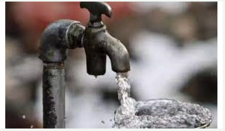
సిద్దిపేట, ప్రజా స్వేచ్ఛ